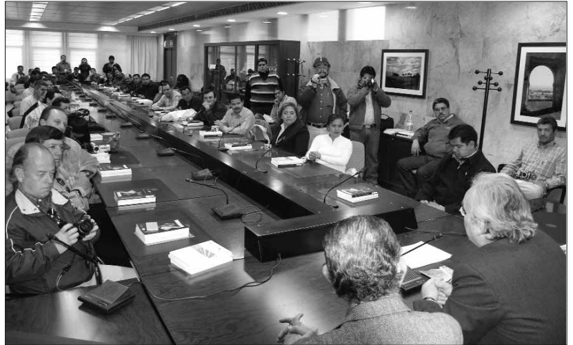
Momento de la entrega de los diplomas de la I Edición del Diplomado Internacional de Horticultura