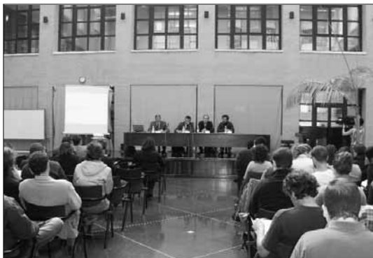
El premio Nacional de Economía durante su conferencia en la Universidad