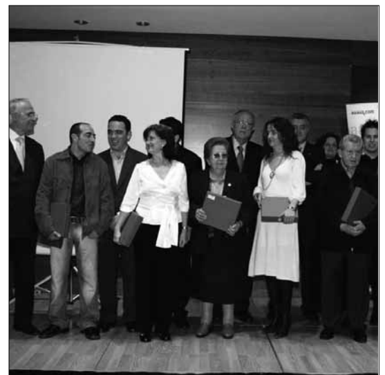
Los premiados el pasado viernes en la gala de los antiguos alumnos