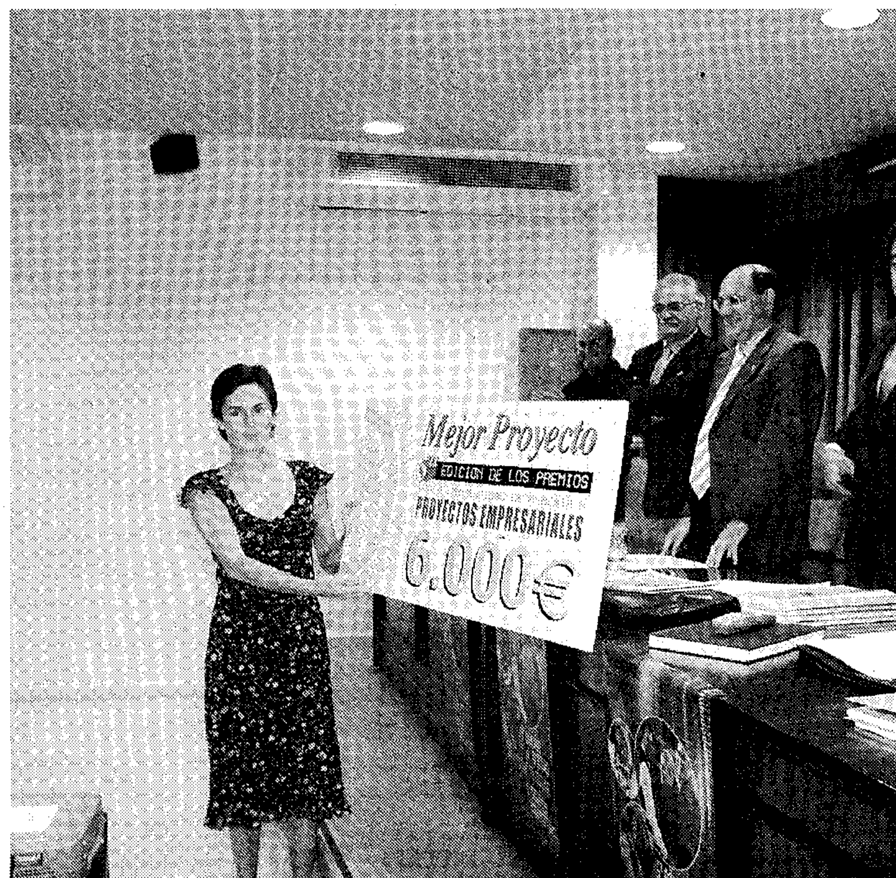
IDEAS. Ganadores de una edición anterior de los Premios.

Al ganador de la primera fase del Premio a Iniciativas Económicas se unirán los de los participantes cuyos trabajos resulten premiados a partir del próximo 2 de abril.