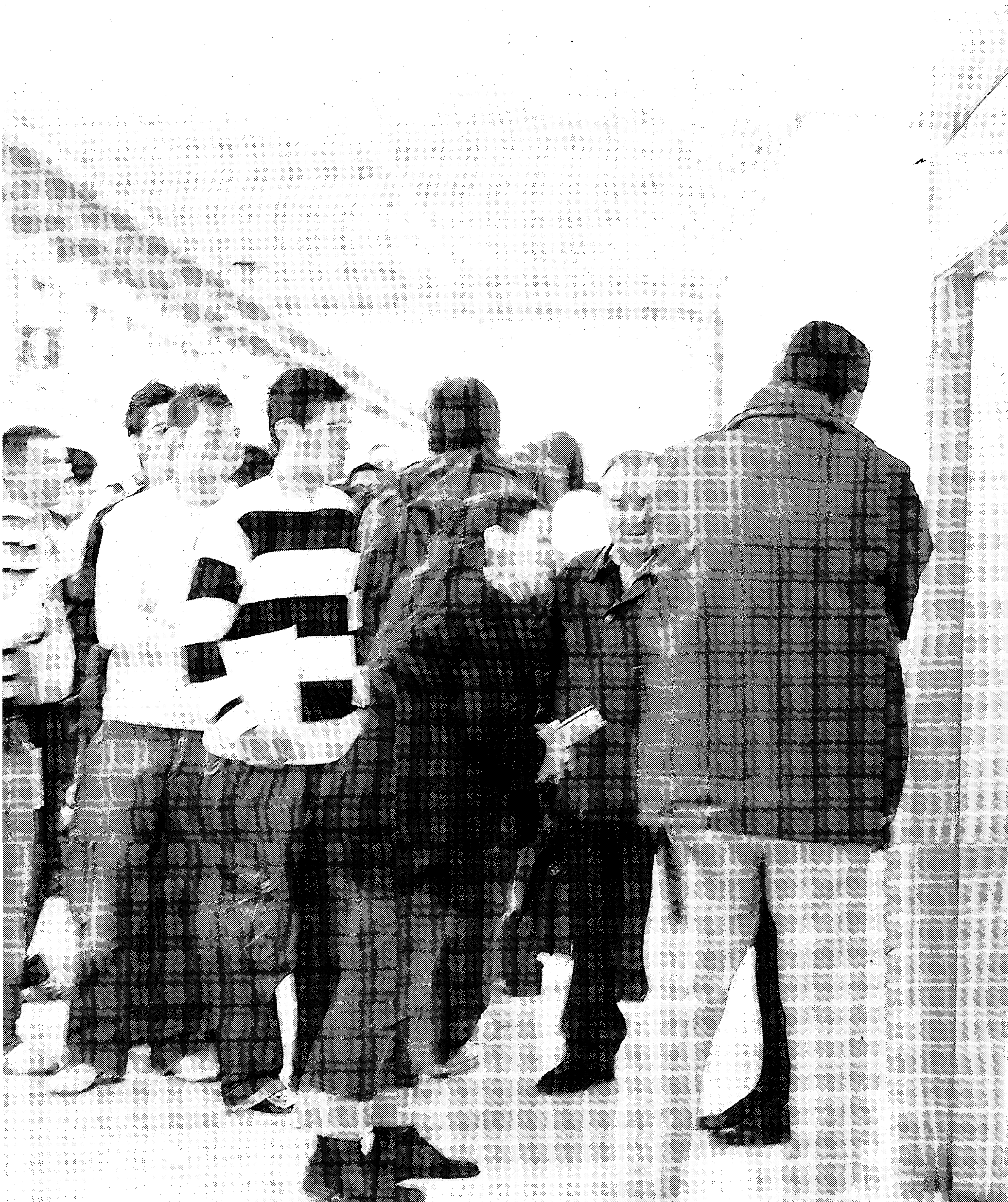
COLAS. Universitarios esperan en el Edificio Central de la UAL para votar anticipadamente.