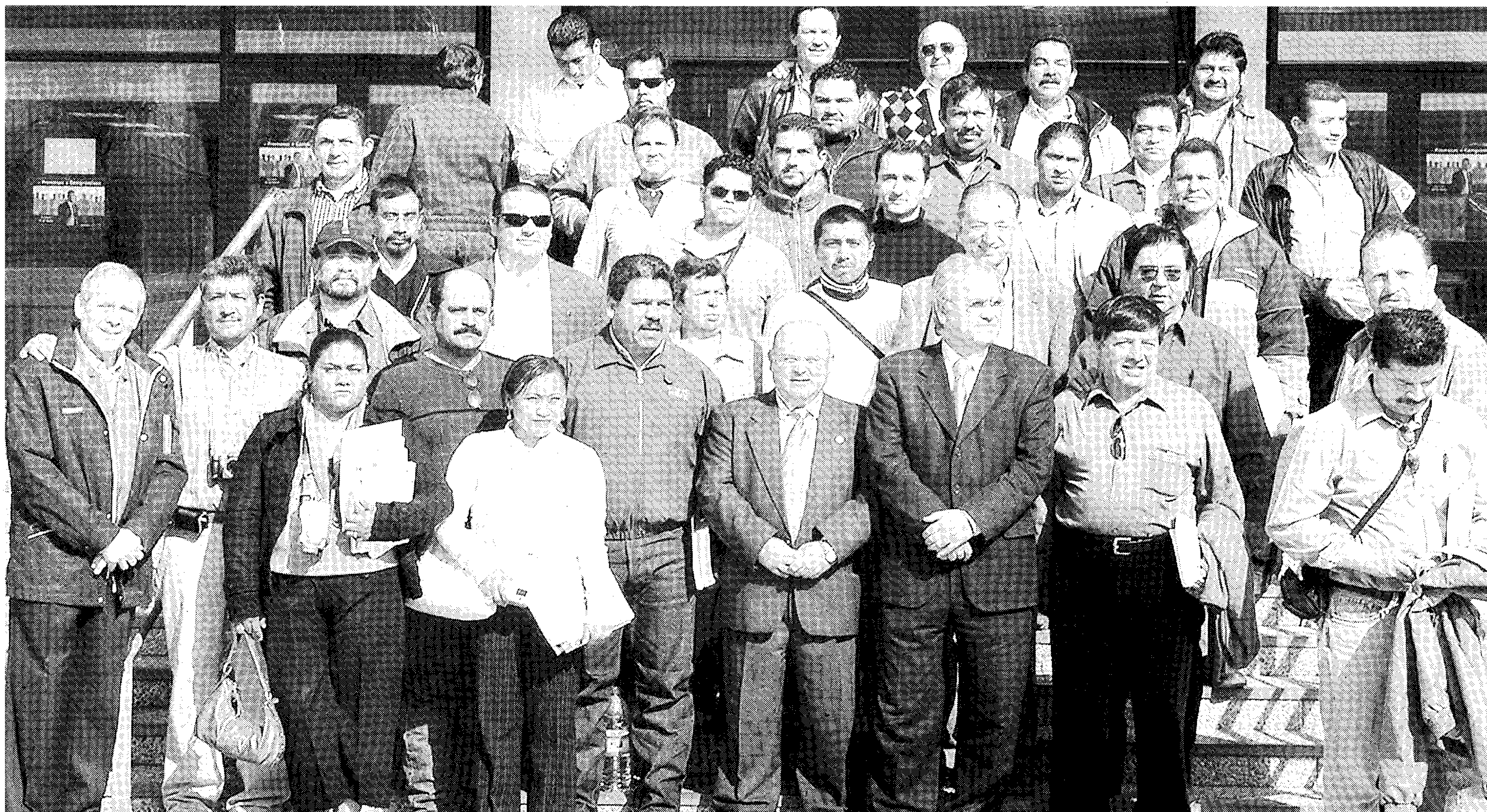
TITULADOS. Primeros diplomados mejicanos por el título propio que imparte la UAL sobre Horticultura Protegida.