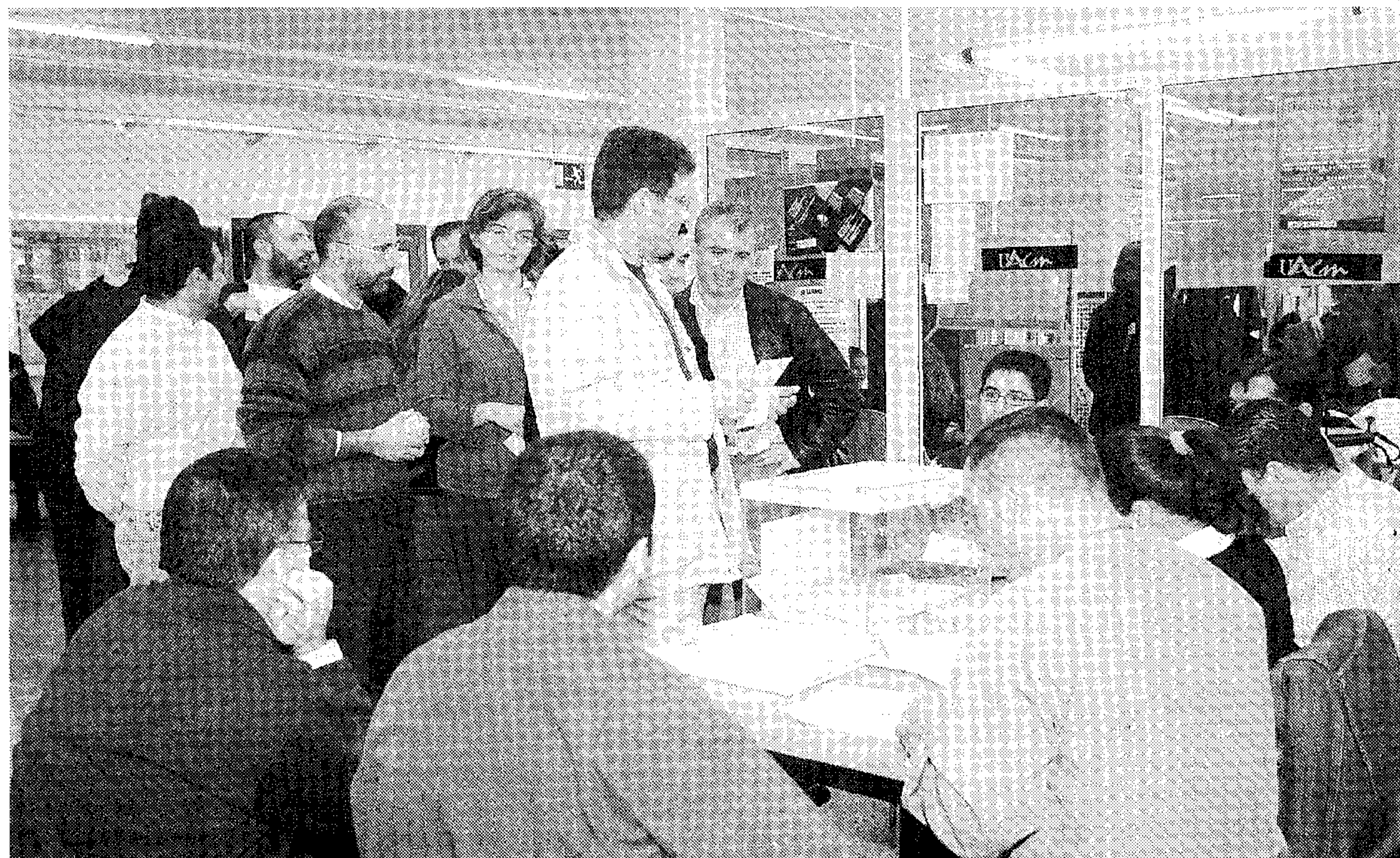
PAPELETAS. Día de las votaciones en las pasadas elecciones a rector.