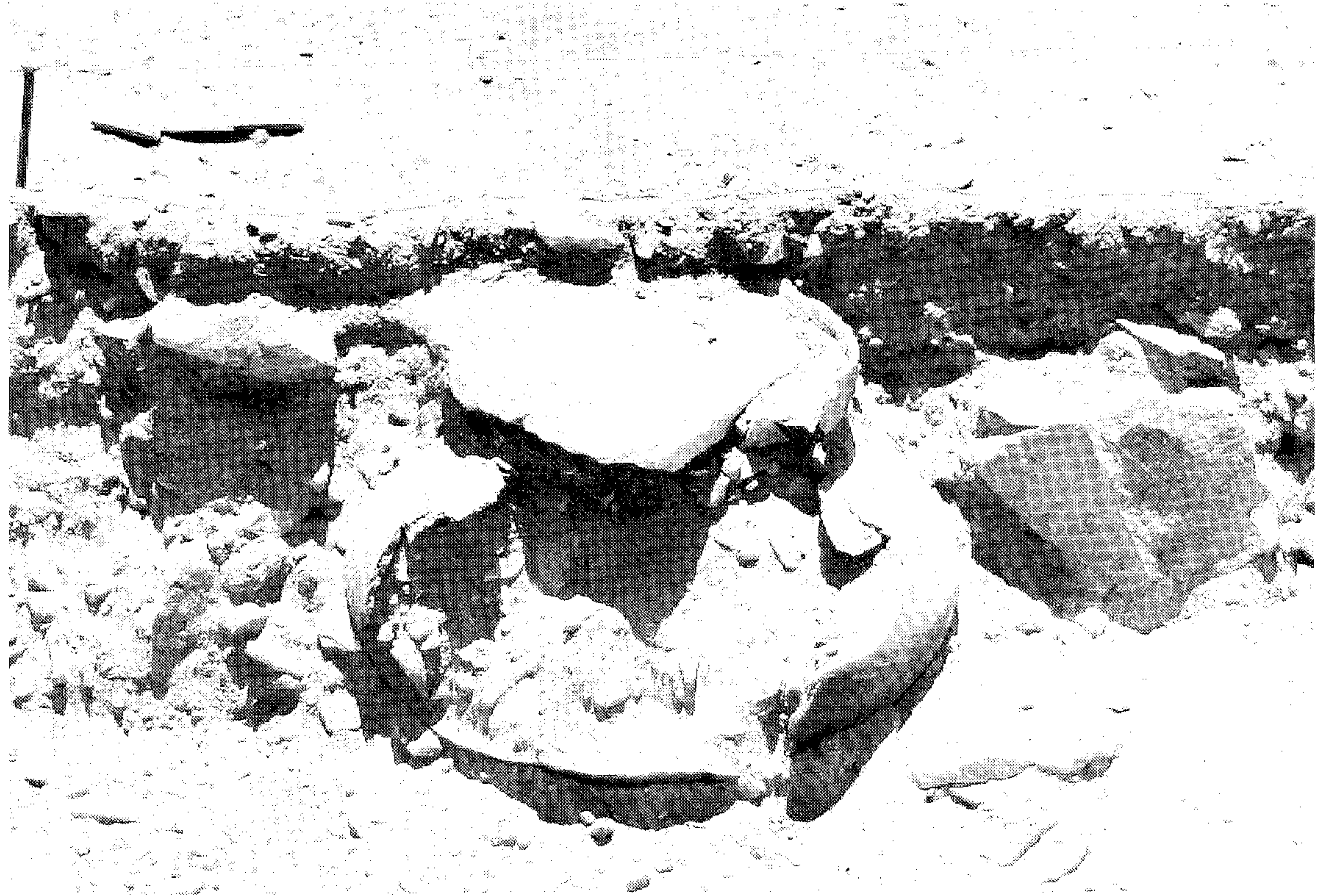
YACIMIENTO. Una de las piezas encontradas en la segunda campaña del proyecto.

Cavalleria rusticana, de Pietro Mascagni (1863-1945), «melodrama» es considerada la primera ópera del verismo musical italiano. A causa de su breve duración, se acostumbra a representar con la otra gran ópera verista, 'Pagliacci', de Leoncavallo.