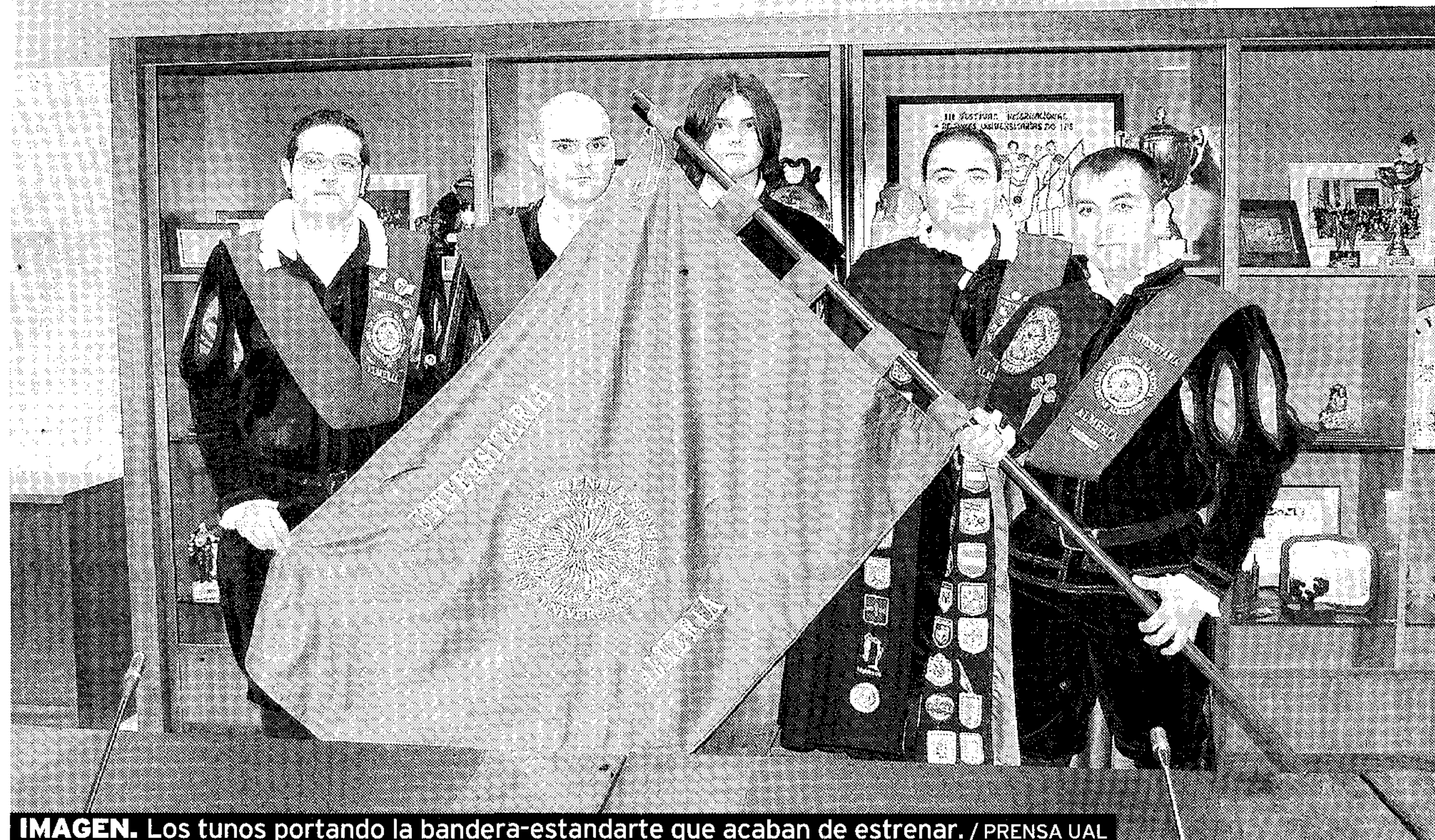
IMAGEN. Los tunos portando la bandera-estandarte que acaban de estrenar.

En los pasillos del Campus de La Cañada no se oye hablar de otra cosa estos días. Las elecciones al Rectorado son el 'monotema' en los sectores del PDI y el PAS. Los alumnos ya son otra cosa, aunque da la impresión de que en esta campaña se estén involucrando más que en otros procesos electorales, pues grupos de estudiantes han acudido a votar anticipadamente durante esta semana. Todo el mundo hace cábalas sobre los posibles resultados. El sector del Profesorado parece tener las cosas más claras que el resto; los PDI se posicionan del lado de uno u otro candidato con mayor facilidad que sus compañeros del PAS. En este segundo colectivo hay mucho indeciso o, al menos, eso es lo que se escucha en los pasillos. La lucha por los alumnos está centrando gran parte de este último tirón de la campaña, los resultados en este sector podrían decantar las votaciones. Nada está claro, podría haber incluso segunda vuelta, pues la experiencia nos dice que en estos casos pueden darse sorpresas. Habrá que esperar hasta el día 29 para avanzar un resultado con certeza, aunque seguro que los días después de que la comunidad universitaria acuda a las urnas ya tendremos noticias del posible futuro rector de la UAL. Los últimos esfuerzos por captar votantes están creando cierta tensión en el Campus, el lunes podría poner el punto final a tantos nervios.