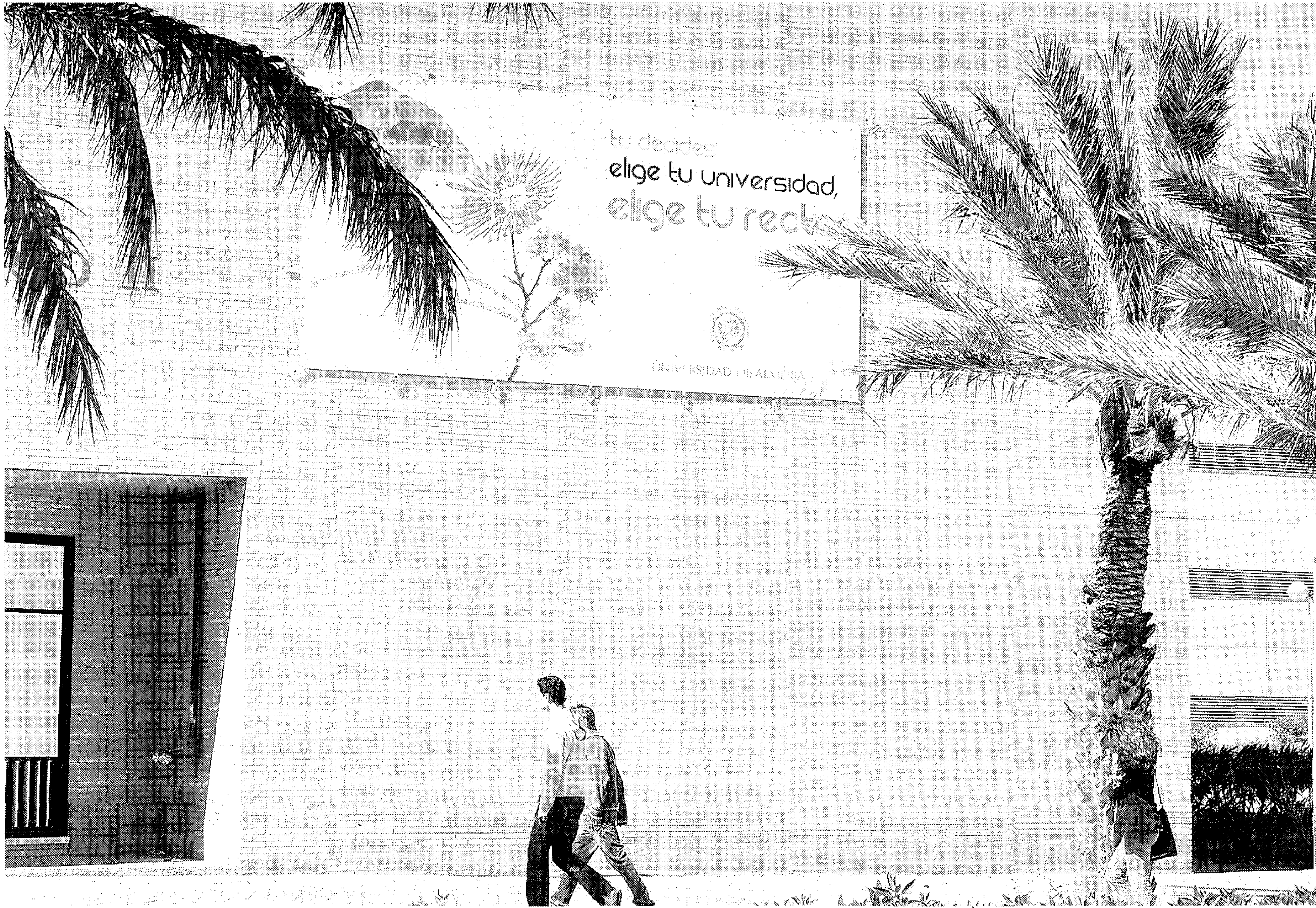
CARTEL. Imagen de la campaña institucional para animar a la gente a que acuda a las urnas.