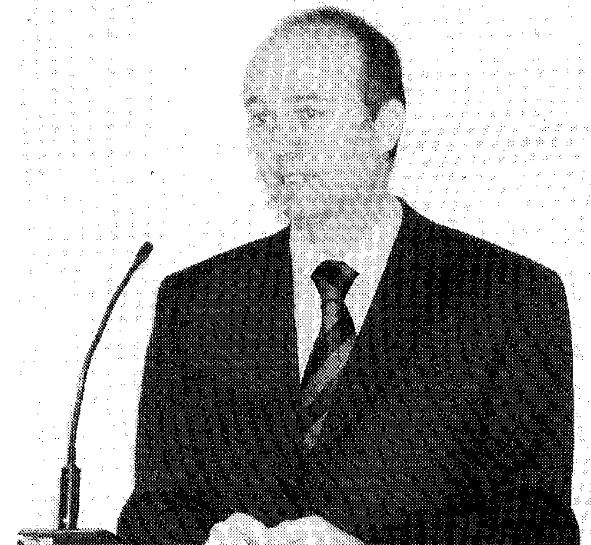
Acto de entrega de los premios .