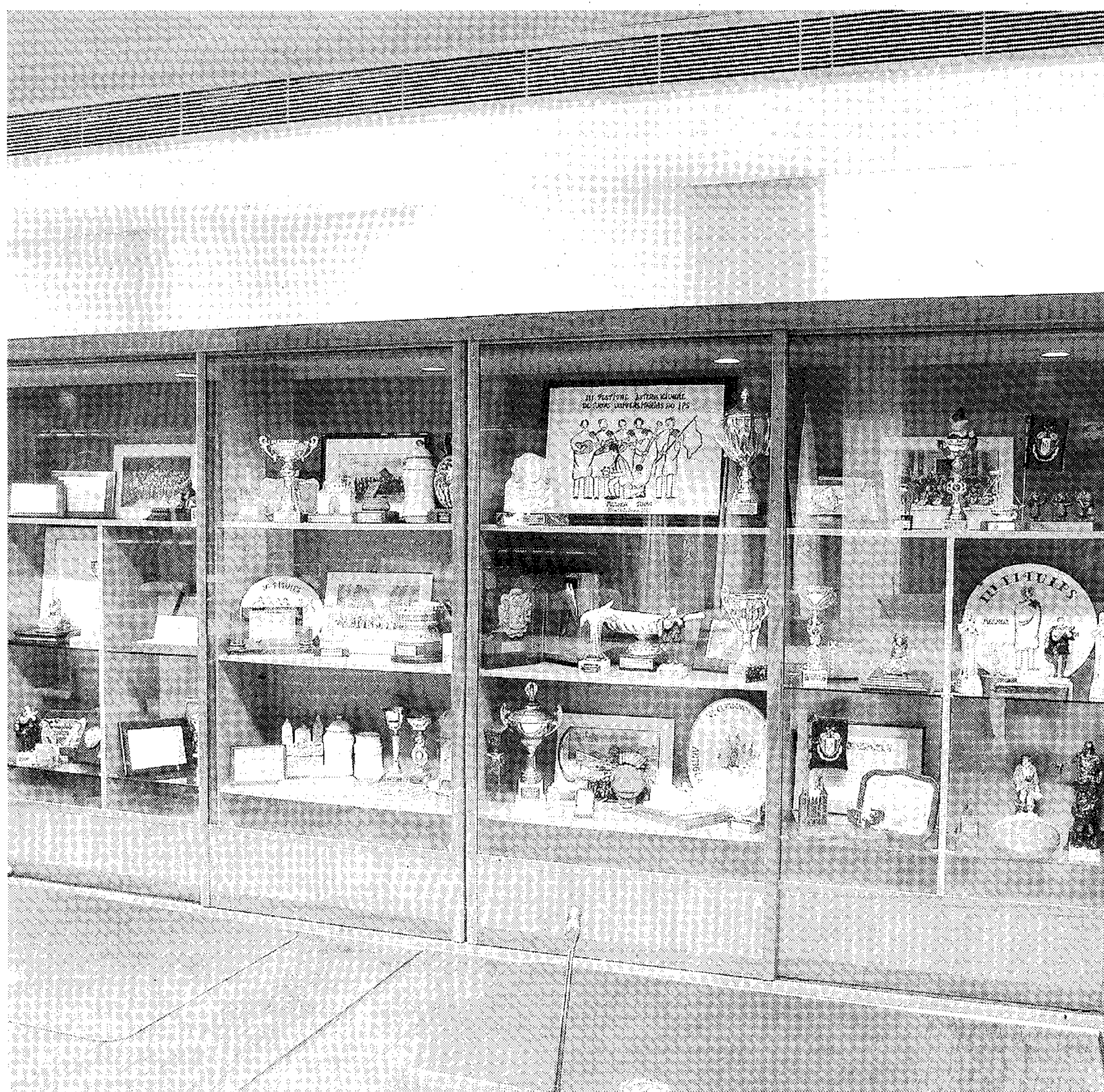
RECTORADO. Nueva vitrina de la Tuna Universitaria.

Expertos de la Universidad de Almería trasladan sus conocimientos en el ámbito hortícola a Méjico. La UAL y el Instituto para la Innovación Tecnológica en la Agricultura, INTAGRI, (Méjico) han puesto en marcha el Segundo Diplomado Internacional en Horticultura Protegida. El objetivo del título es capacitar a profesionales mejicanos para organizar, dirigir y ejecutar las actividades de producción de tomate, pimiento y pepino bajo condiciones protegidas, con el fin de acceder a mercados exigentes en calidad integral de los alimentos.