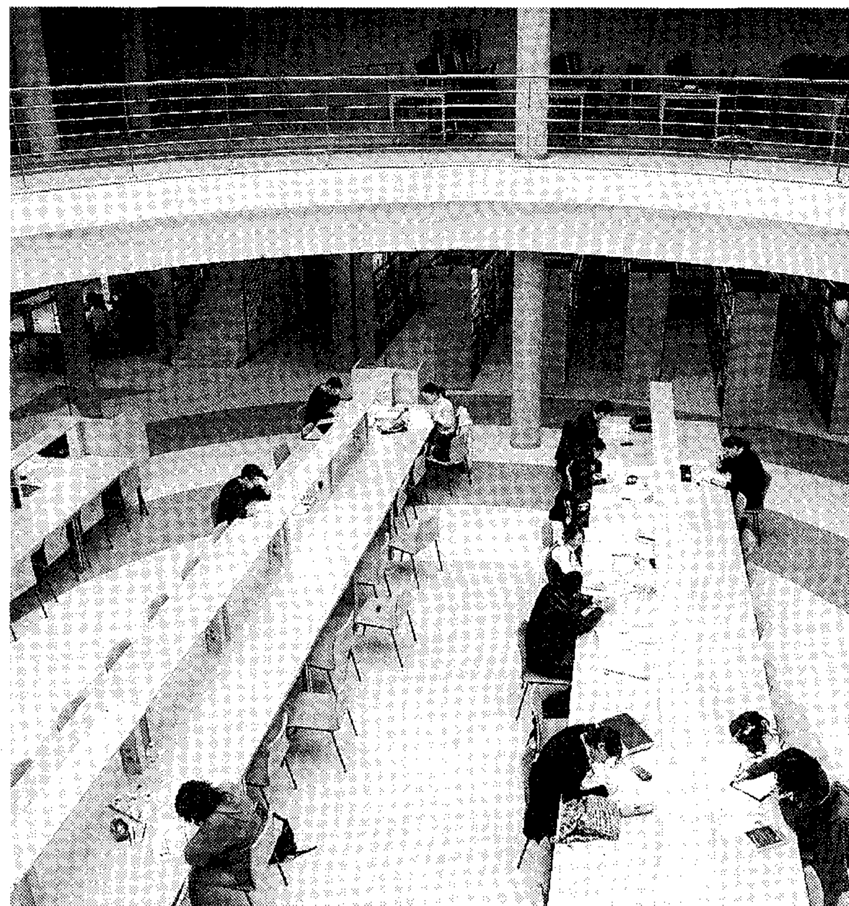
ESTUDIO. Biblioteca Nicolás Salmerón de la UAL.

► Específicas: Biología, Historia del Arte, Química, Dibujo Artístico II, Latín II, Física, Matemáticas Aplicadas CCSS II, Ciencias de la Tierra y el Medio Ambiente, Dibujo Técnico II, Economía y Organización de Empresas, Electrotecnia, Fundamentos de Diseño, Griego II, Historia de la Música, Imagen, Mecánica, Técnicas de Expresión Gráfico-Plásticas, Tecnología Ind. II, Matemáticas II y Geografía.