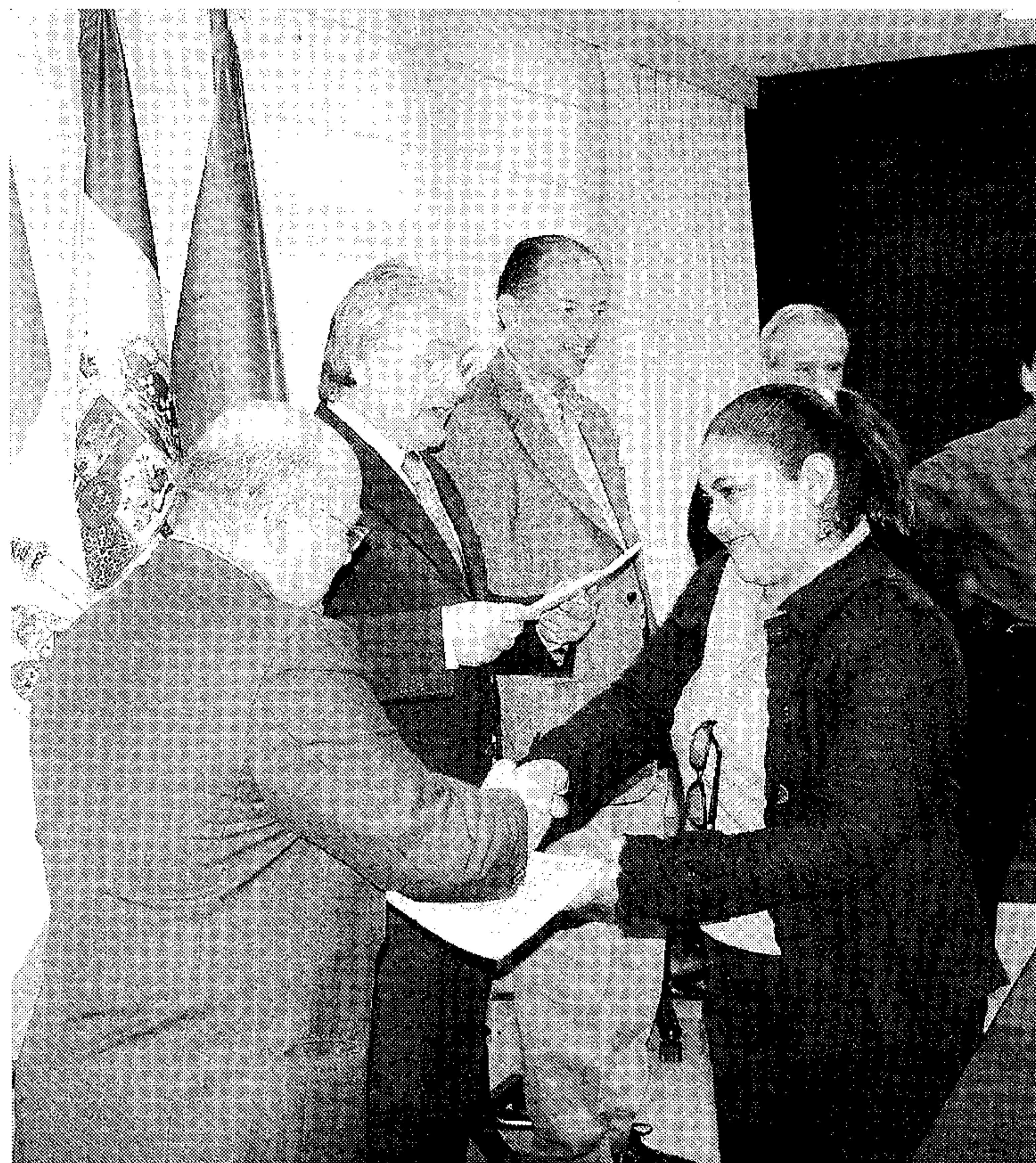
Acto de entrega de los Diplomas en el Rectorado.

Las inscripciones del Segundo Diplomado se cerrarán el 30 de marzo. La matrícula se realiza en el INTAGRI, que lleva a cabo todos los trámites administrativos. La matrícula da derecho a clases teóricas y prácticas, material didáctico, libros y el diploma acreditativo.