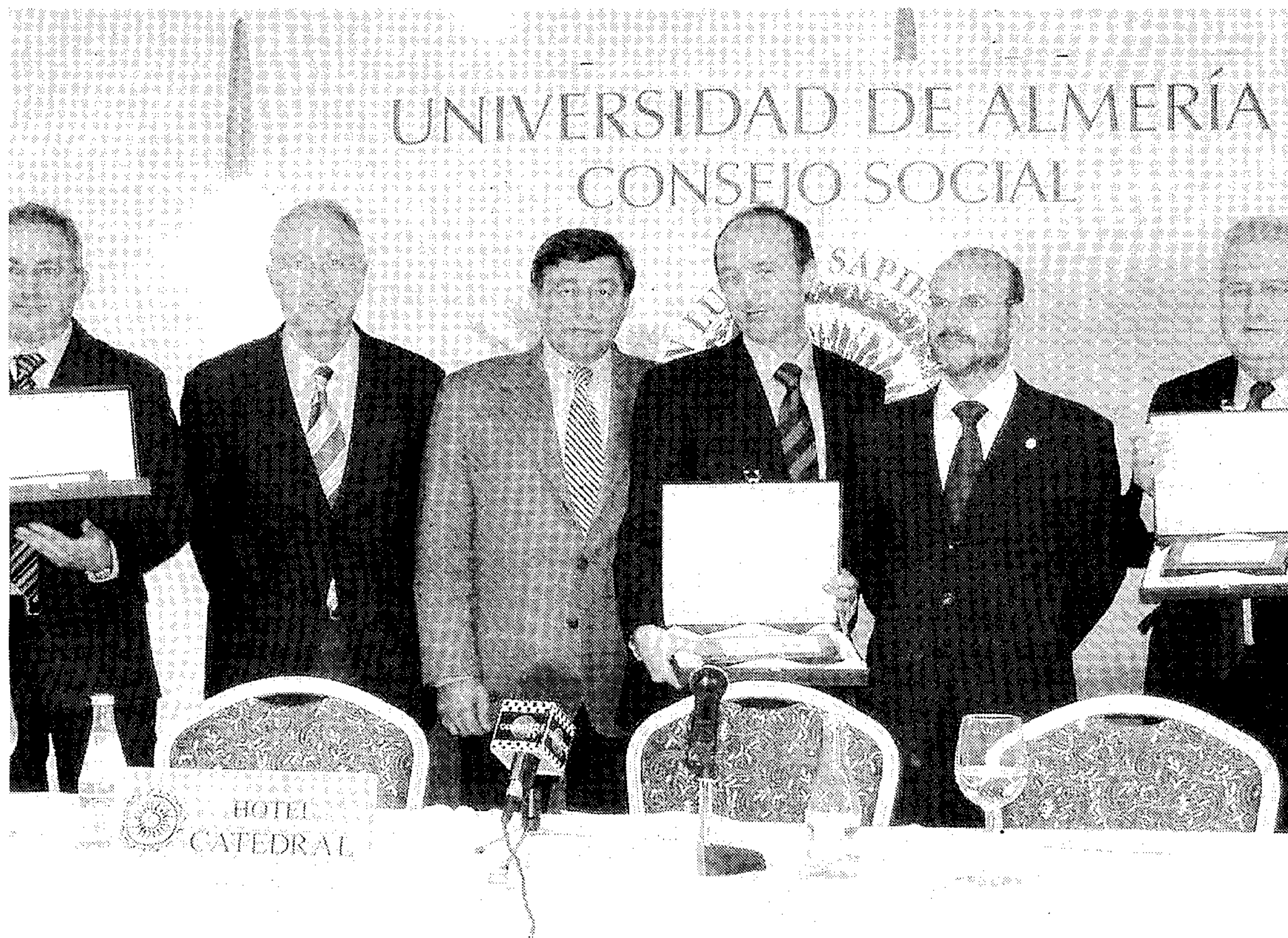
ACTO. Entrega de uno de los premios, durante el acto celebrado en la Delegación de la Junta. / IDEAL

Por otro lado, la entidad Proyecto Empresarial Brudy S.L. fue premiada como grupo distinguido por sus actividades con la UAL gracias a lo innovador de sus investigaciones biotecnológicas, a través de la síntesis de lípidos como nueva estrategia en la lucha contra la Lipodistrofia en SIDA y nuevos tratamientos contra el cán-