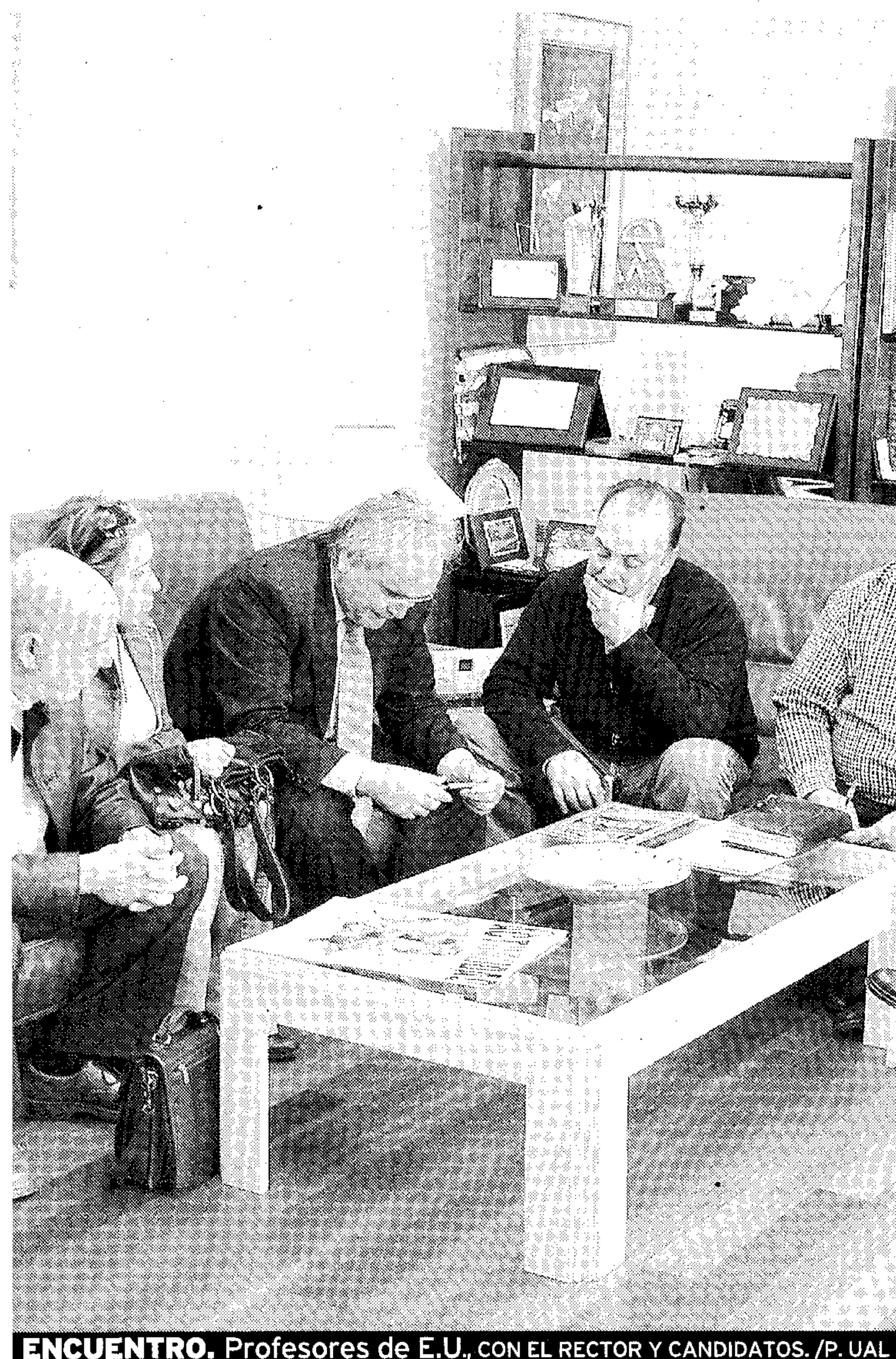
ENCUENTRO. Profesores de E.U., con el rector y candidatos.

La Tuna Universitaria ya cuenta con una vitrina propia en la que colocar los trofeos que ha conseguido en sus años de historia. La vitrina fue inaugurada la semana pasada por responsables de la UAL. Se ubica en la Sala de Reuniones del Rectorado (Edificio Central de la UAL).