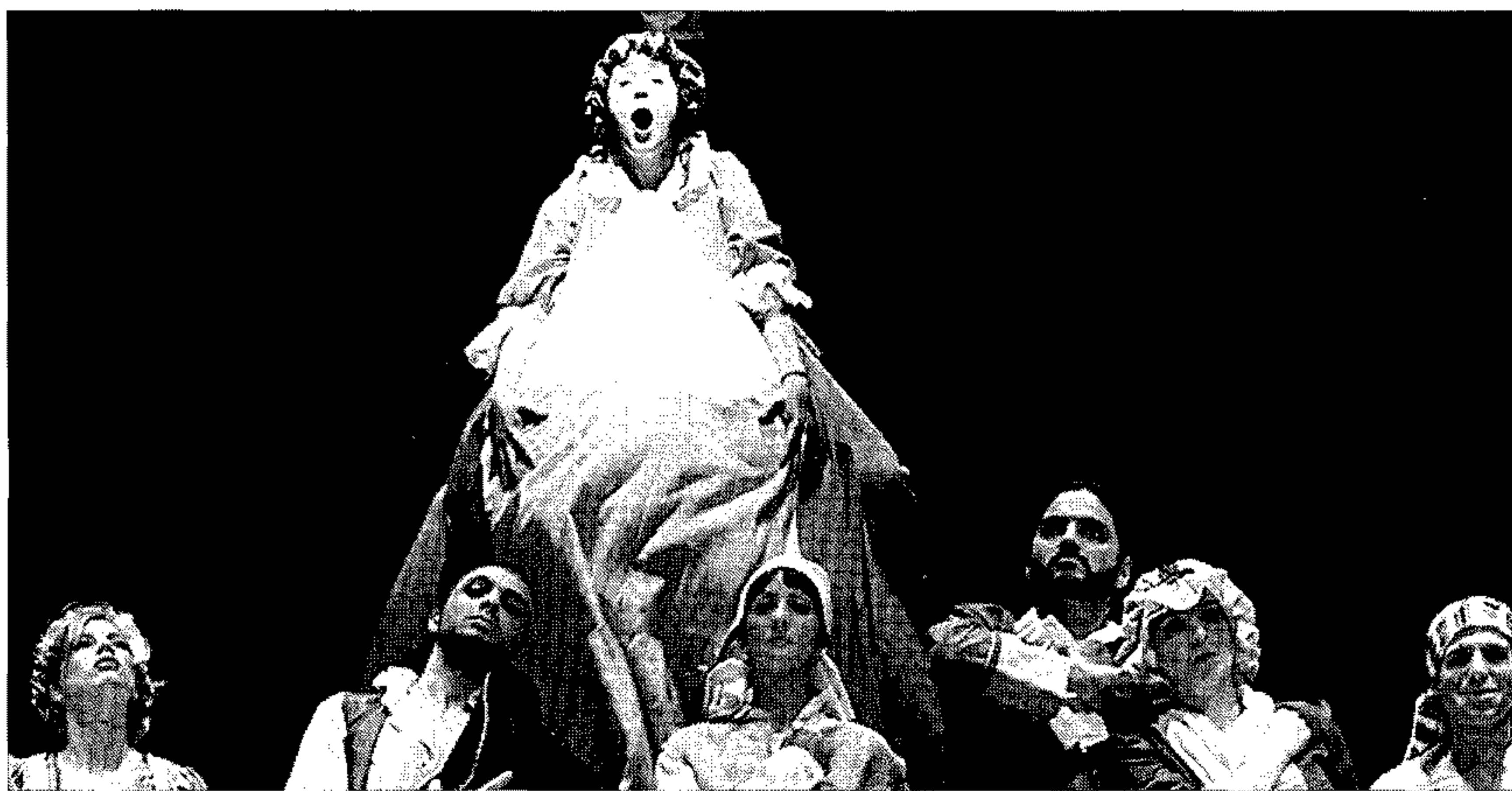
Un momento del entremés 'La infanta Palancona', a su paso por Roquetas de Mar.

De las Jornadas del Siglo de Oro a la Muestra de Teatro de Andalucía con sus entremeses