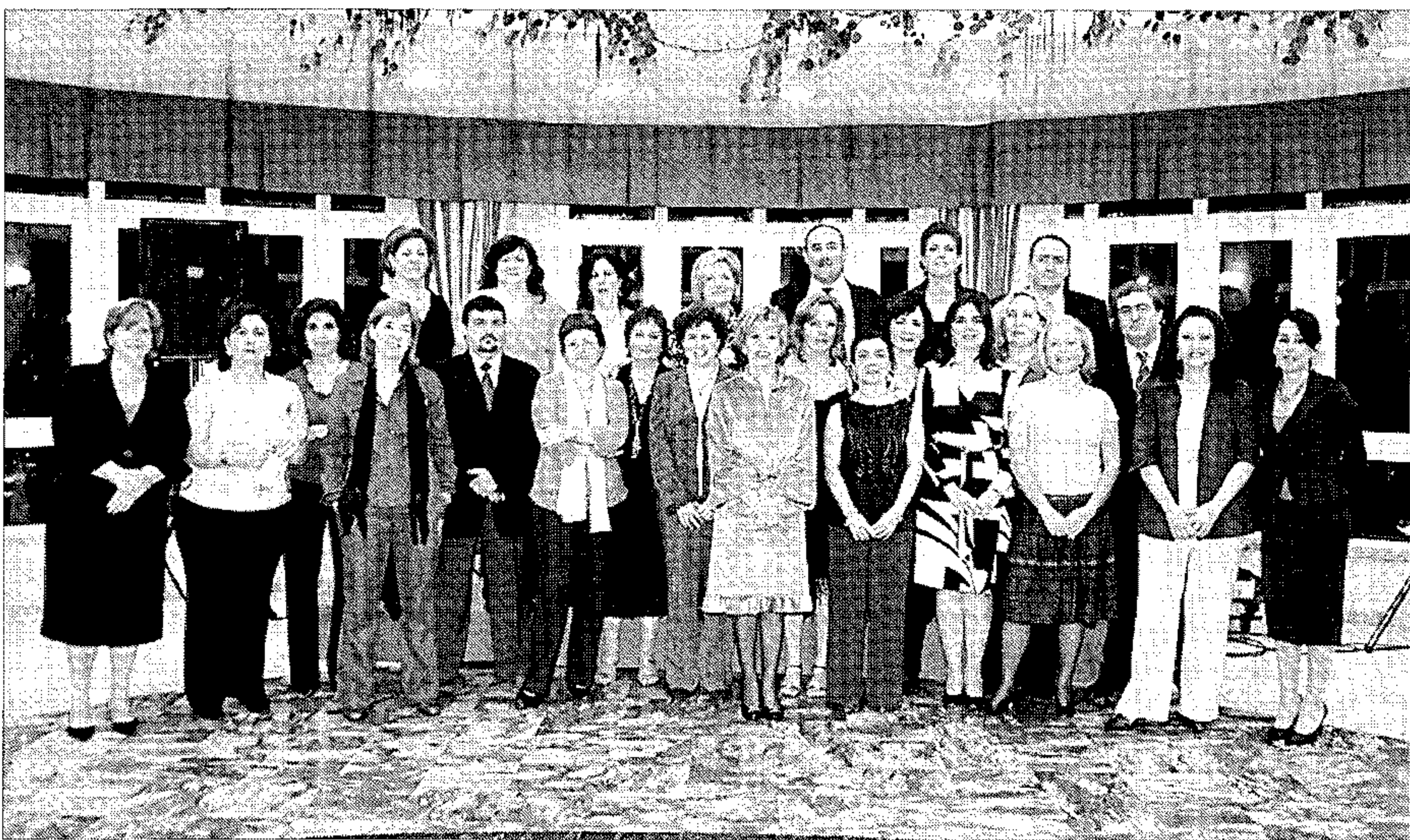
La presidenta del Colegio con los integrantes de la promoción 82 que recibieron un reconocimiento por los 25 años de profesión.