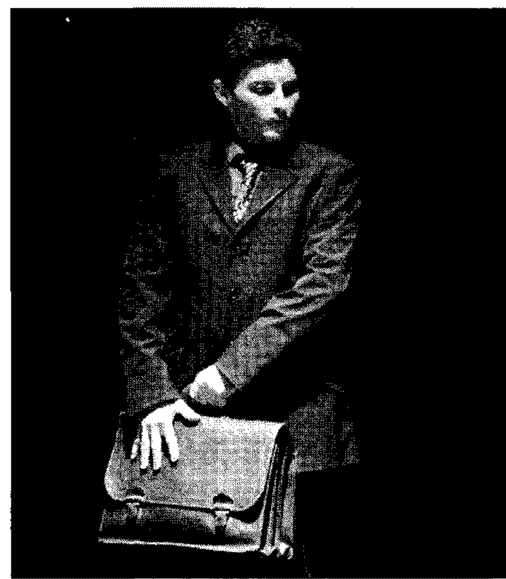
Uno de los actores durante la representación. / J.F.