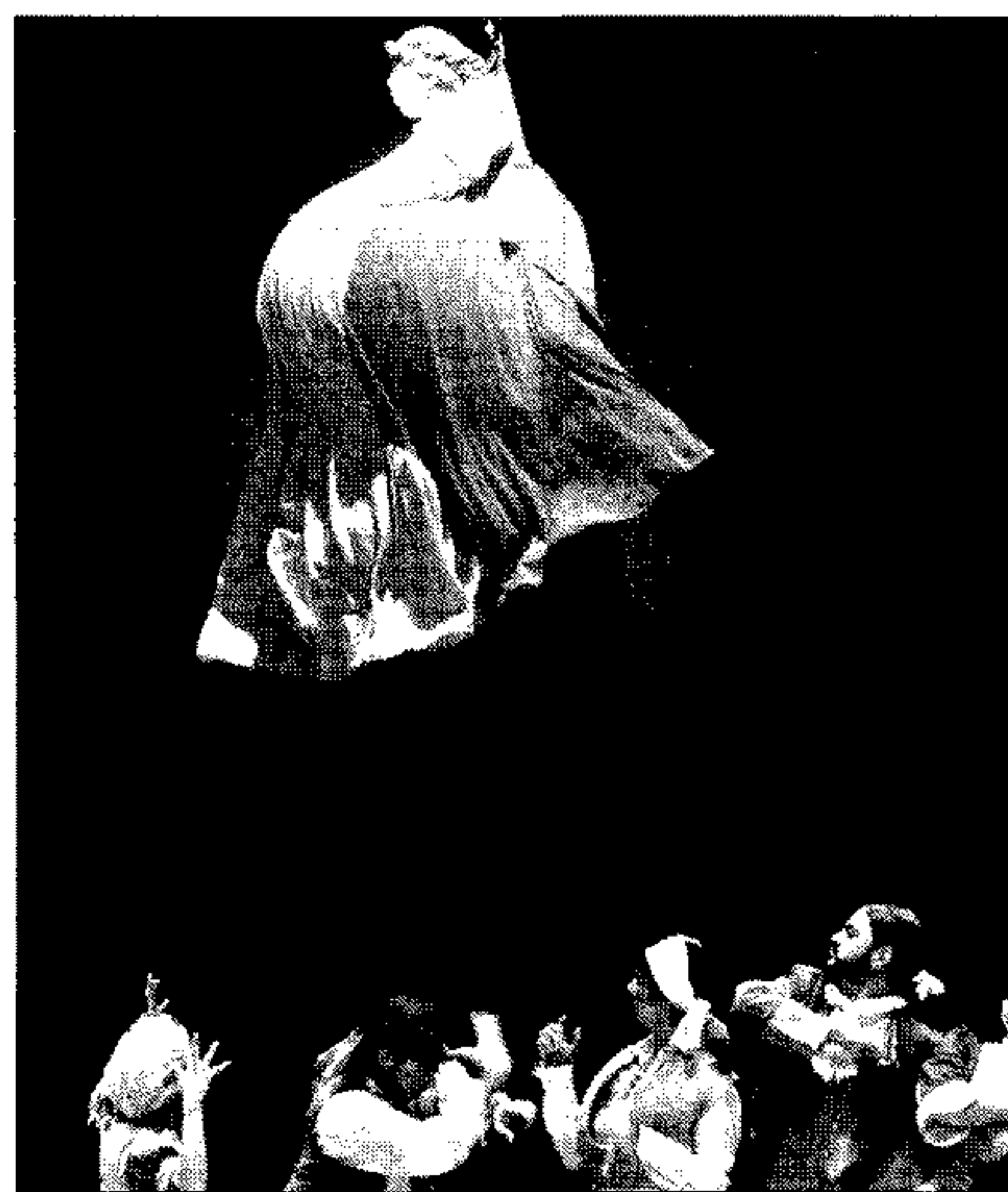
La puesta en escena estaba muy cuidada.