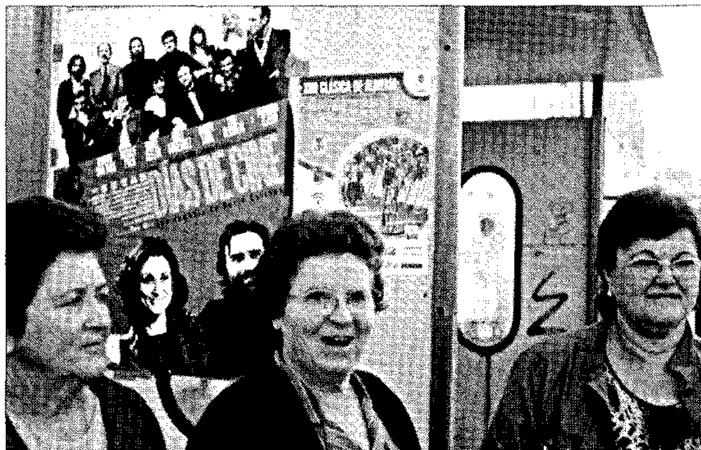
Las vecinas de Lucainena ante un cartel de la película de ayer.

El ciclo 'Cine de Estreno' se inauguró el viernes con la proyección de las tres películas en Cantoria, Berja e Instinción. En la tarde de ayer otros tantos pueblos pasaron noventa minutos entre las historias que proponen las tres películas recién estrenadas. 'Hoy Días de cine', 'Admitido' e 'Invencible' viajarán hasta Vélez Rubio, Gádor, Tijola, Pulpi, Carboneras o Tavernas. Seis pueblos que hoy podrán ver en sus pantallas lo mismo que en los cines de una gran ciudad.