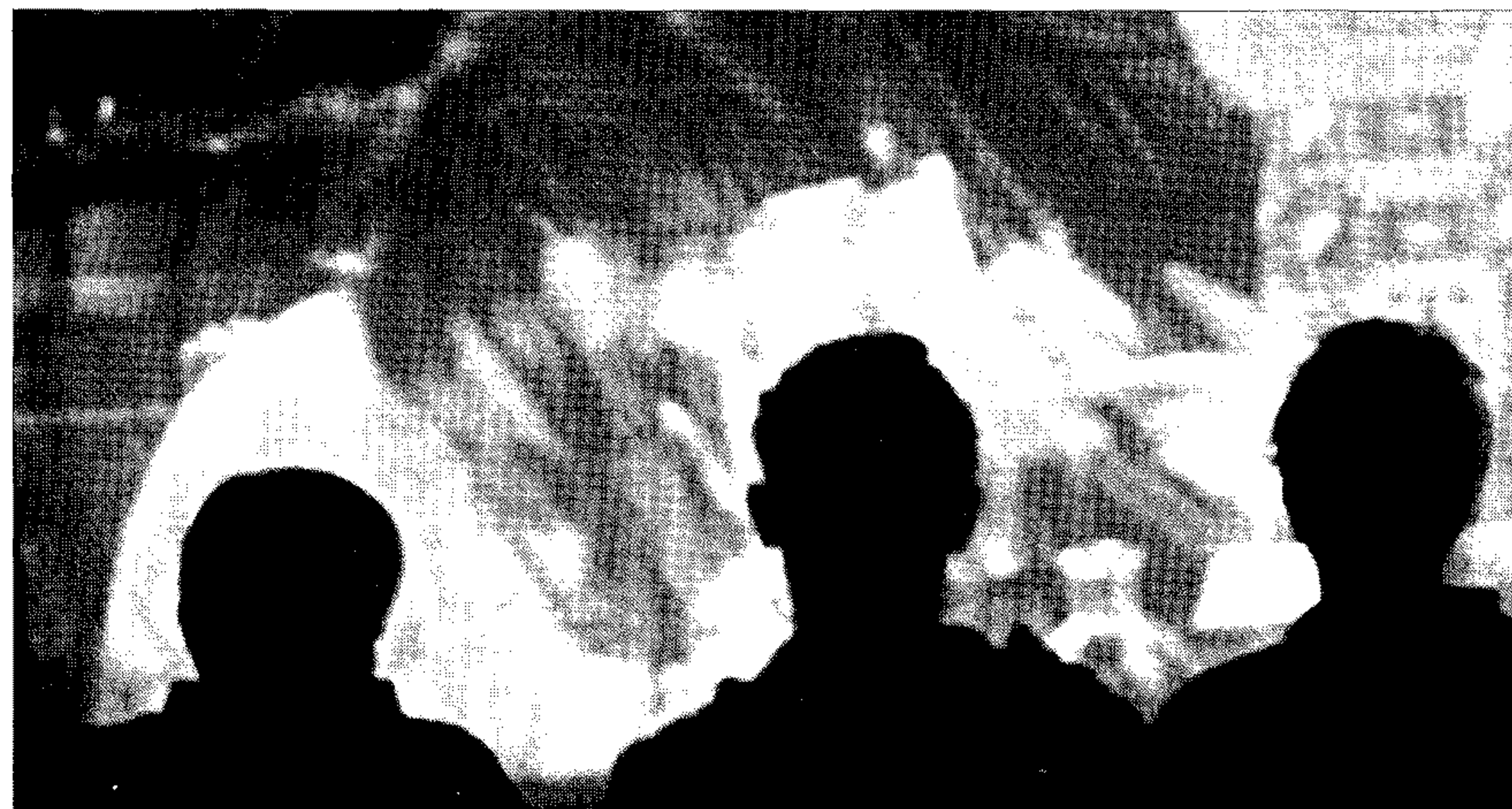
Ayer en Lucainena de la Torres, mayores y pequeños se acercaron a ver 'Días de cine'.

Con palomitas o sin ellas, la idea de 'Cine de estreno' es que los amantes del cine de Tabernas, Serón o Lucainena de las Torres, por