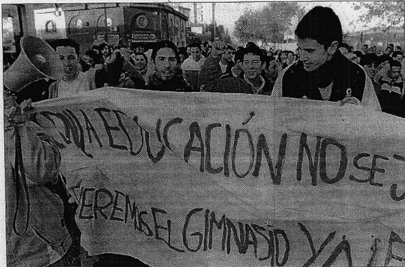
Manifestación de los alumnos de Jerez la semana pasada.