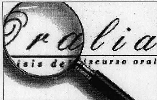
La dirección en internet es 'nevada.ual.es/otri/oralia'.

En sus páginas, han publicado hispanistas de diferentes países: Alemania, Argentina,