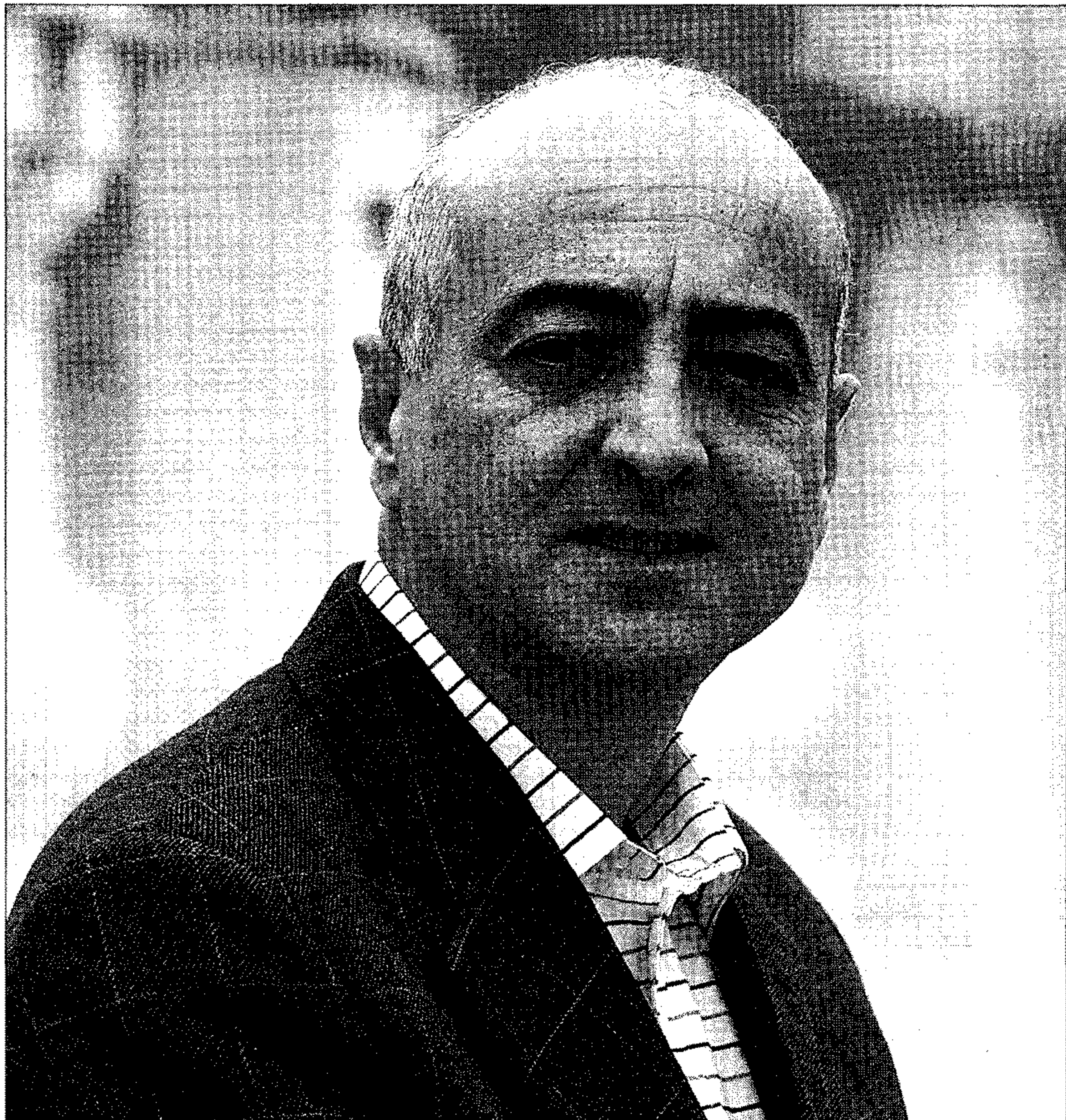
MARINA DEL MAR

R. — A grandes rasgos, nuestro programa se puede dividir en dos partes, en infraestructuras y en las necesidades de los barrios. Ahora estamos profundizando en las carencias de cada barrio y vamos a hacer de todos y cada uno de los núcleos lo que pensamos que se merecen sus habitantes. En el otro lado, estarían las grandes infraestructuras que necesita la ciudad. Estaría el puerto, que queremos recuperarlo para el disfrute y beneficio de los ciudadanos. El ferrocarril, que pensamos que debería entrar por detrás de la ciudad, es decir, eliminando esta línea que divide Almería en dos ciudades prácticamente distintas, reduciendo así los problemas de movilidad. Desde luego, desdoblaremos la N-340 y lo haremos ipso facto , sin más dilación. Pondremos en marcha las medidas que sean necesarias para descongestionar el tráfico de la capital, como por ejemplo, crear la circunvalación Este-Norte, que estamos estudiando exactamente por dónde debe transcurrir. En el casco histórico haremos un acceso desde la autovía del Mediterráneo a los alrededores de La Alcazaba, creando previamente las infraestructuras necesarias en temas de limpieza, mobiliario, adecentamiento de edificios y aparcamientos, puesto que sólo hay que ponerlo en valor. Almería es una ciudad preciosa y los políticos que llevan en el poder los últimos 30 años no se han dado cuenta de que está llena de