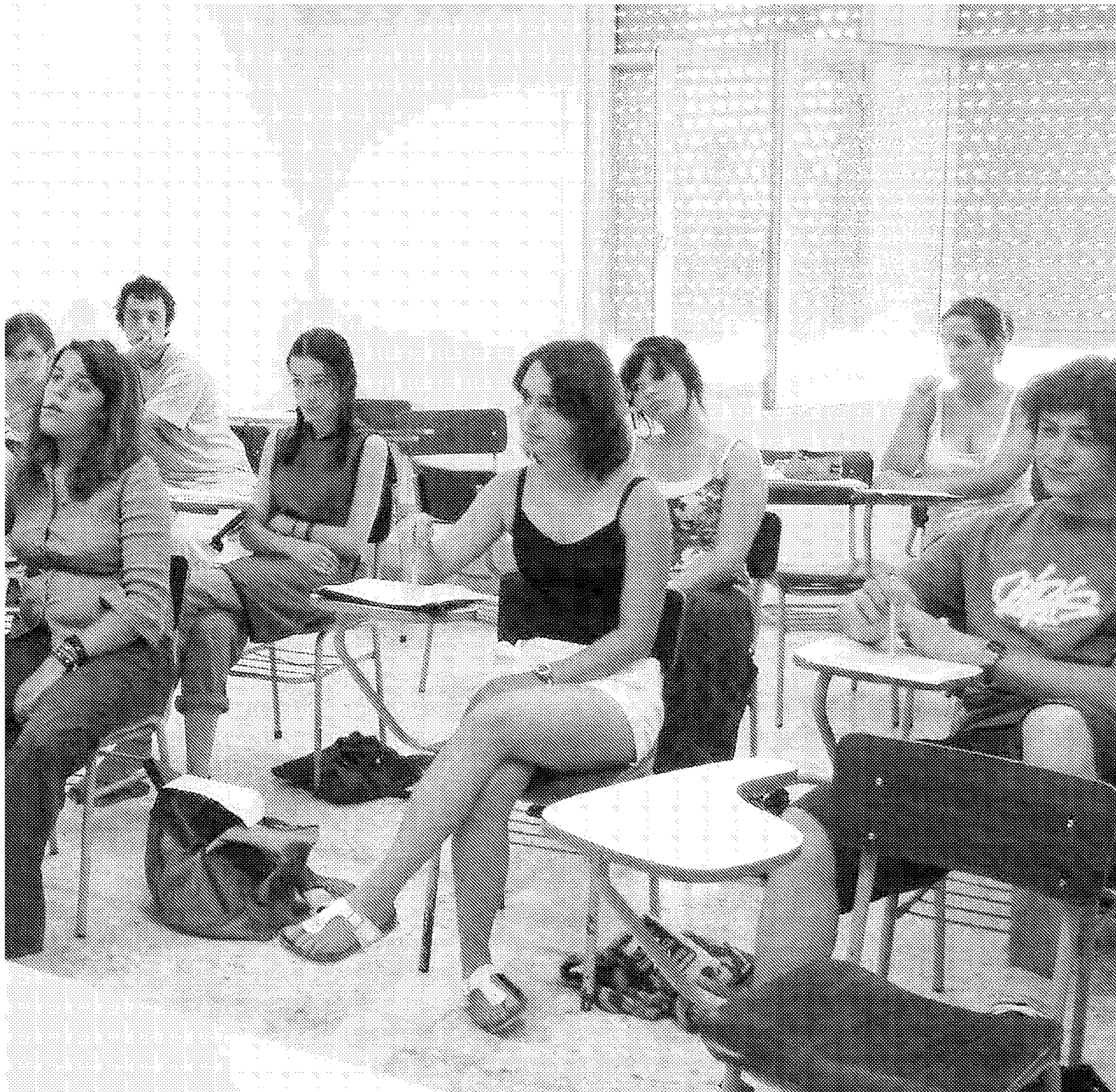
en el campus de La Cañada de San Urbano.