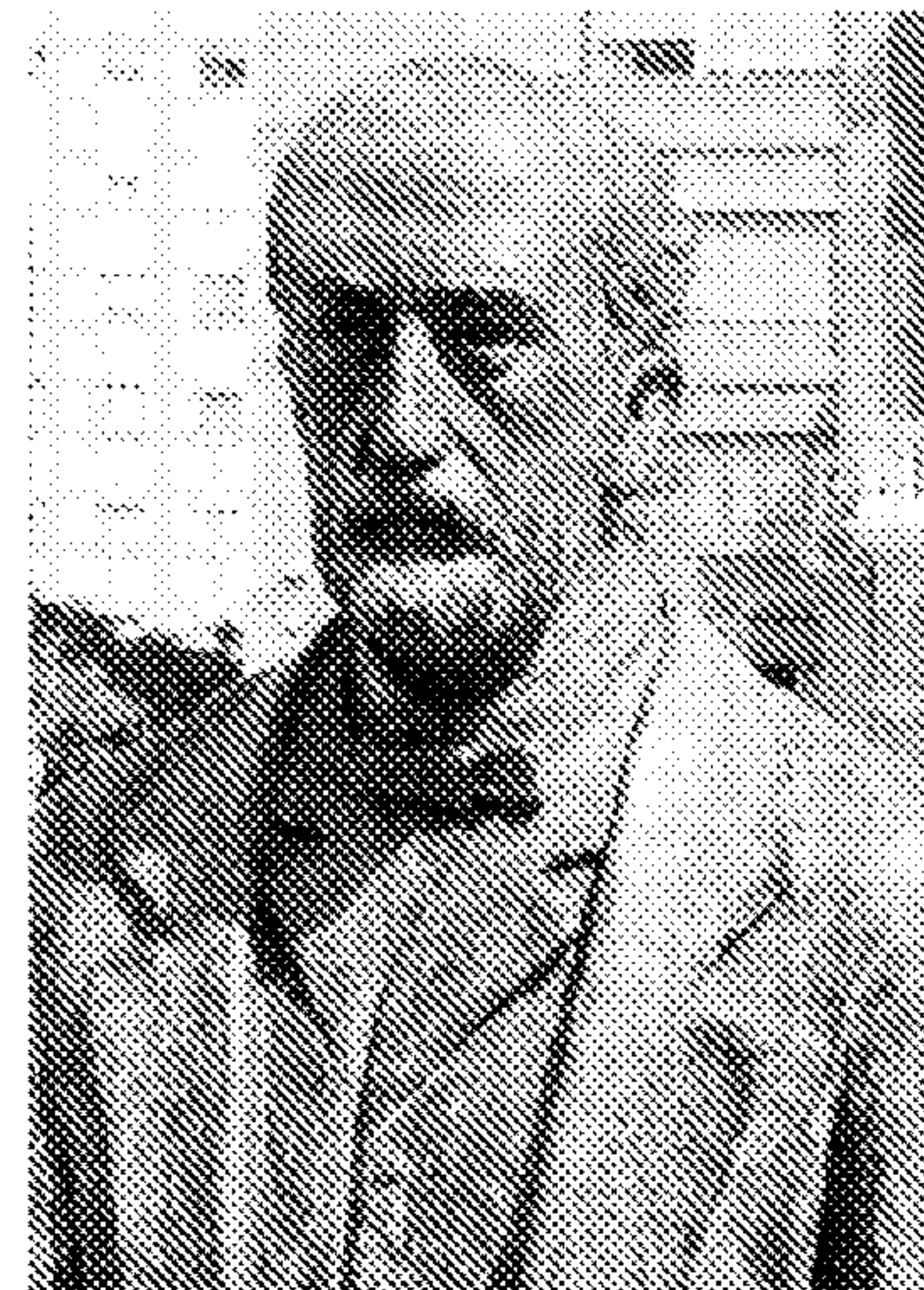
ESTATUA. Salmerón.

La iniciativa concluirá con una recogida de firmas para pedir al Ayuntamiento de Almería que instale una placa identificativa en la estatua, lo que permitirá a los transeúntes, sobre todo los foráneos, identificar al destacado político almeriense.