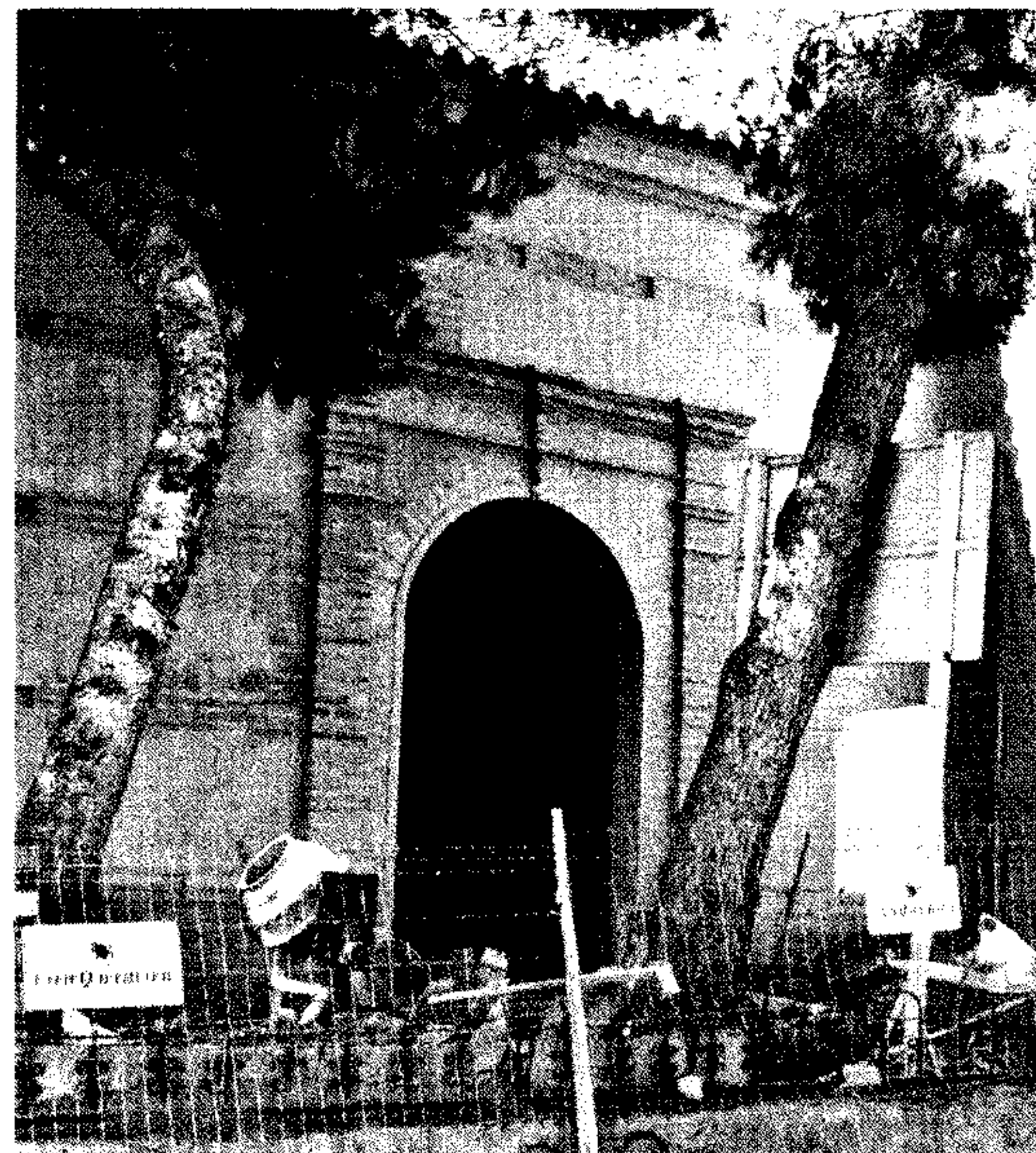
IGLESIA DE LA ALQUERÍA. Se trata del templo más antiguo que se conserva en el término municipal. Data del siglo XVI.