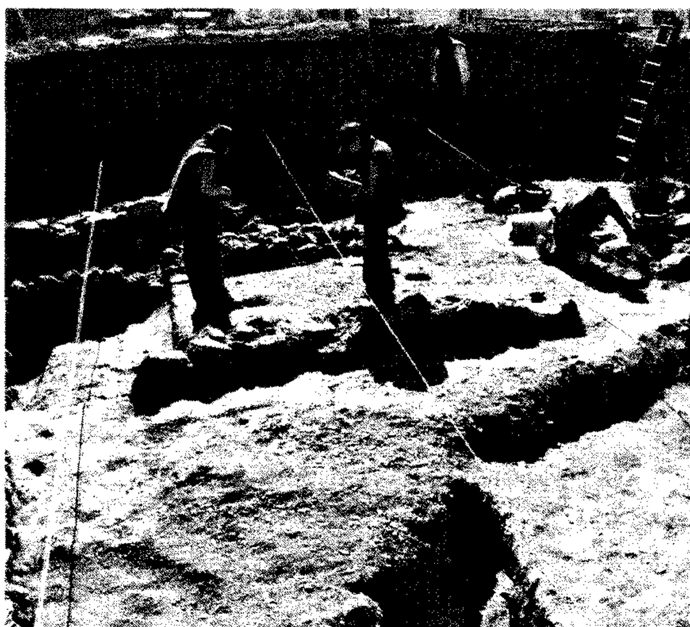
EXCAVACIONES. Los restos arqueológicos hallados hasta el momento confirman la importancia histórica y el singular legado que tanto fenicios como romanos tuvieron en el presente de la ciudad abderitana.

Por otra parte, el 2006 también ha valido para recuperar la Iglesia de La Alquería, un templo religioso del siglo XVI, el más antiguo de Adra. En su empeño de conservar y poner en valor el patrimonio histórico que aún se conserva, el equipo de gobierno ha iniciado la rehabilitación de este monumento con la ayuda del Obispado de Almería. La restauración del Arco de Las Ánimas y los procesos de desactivación llevados a cabo en el entorno de los Torreones para su posterior rehabilitación por parte de la Junta de Andalucía, centran las actuaciones más importantes en el panorama cultural e histórico de la localidad.