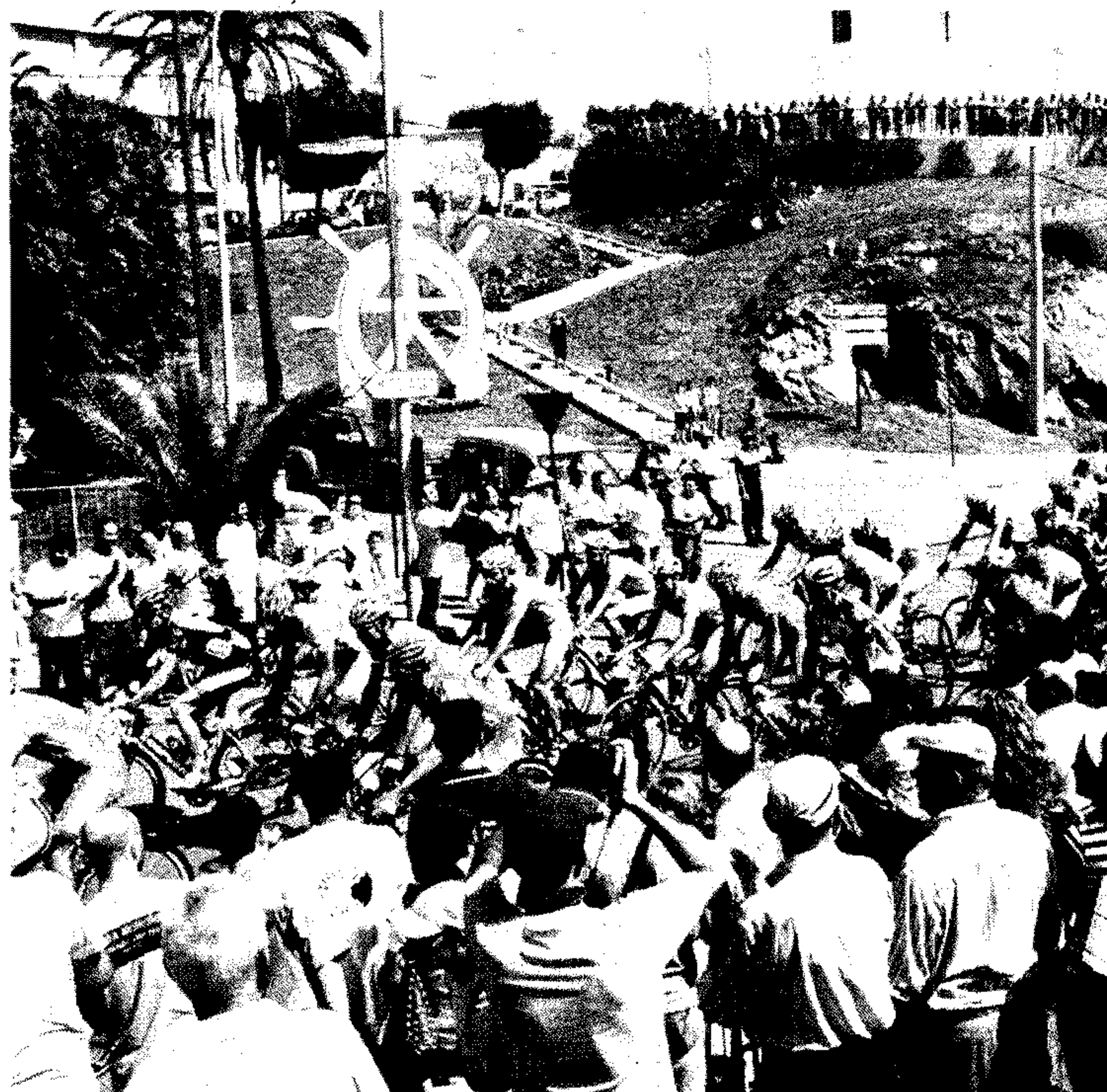
VUELTA CICLISTA A ESPAÑA. Los abderitanos se volcaron para acoger este evento deportivo haciendo uso de su hospitalidad y su cariño hacia los ciclistas.