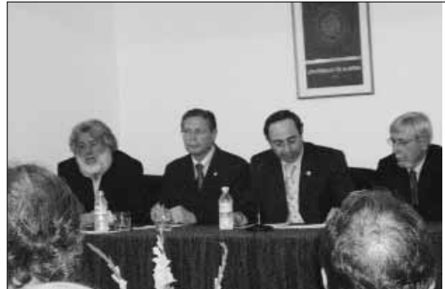
Momento de la firma del convenio entre UAL y la delegación de Igualdad