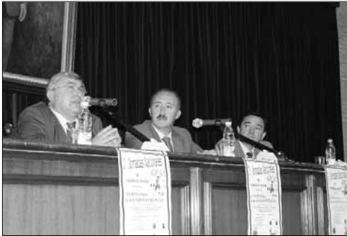
Momento de la inauguración de las Jornadas de violencia escolar