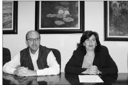
Director de la Escuela Politécnica y la coordinadora de las jornadas

Los días 27 y 28 por la mañana estarán destinados a la presentación de los trabajos científicos, con sede en la Universidad de Almería. El día 28 por la tarde, se celebrará una mesa redonda para tratar la problemática del sector, pero en esta ocasión el escenario será la Escuela de Música del municipio de Roquetas de Mar. El