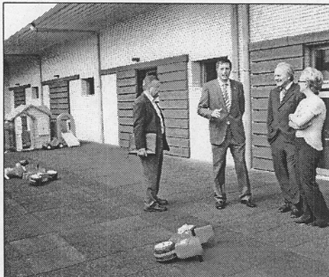
El rector de la UAL con responsables de la Universidad de Alicante

En principio desde la Universidad de Alicante no tienen muy claro cómo van a afrontar el proyecto, pero aseguran que la visita ha sido muy fructífera para ellos ya que la gestión que realiza "El Saliente" les ha convencido ampliamente.