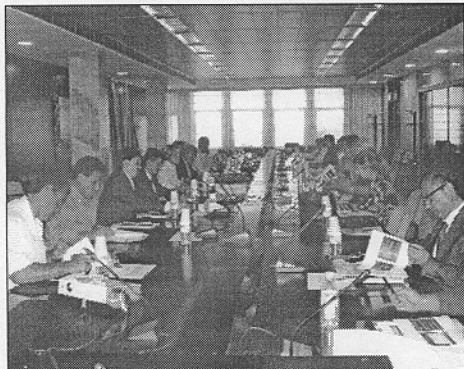
Momento de la reunión desarrollada en la Universidad