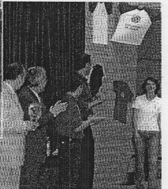
Varios momentos vividos durante la Gala de Clausura del Deporte Universitario que se celebró la pasada semana en el Auditorio de la Universidad de Almería