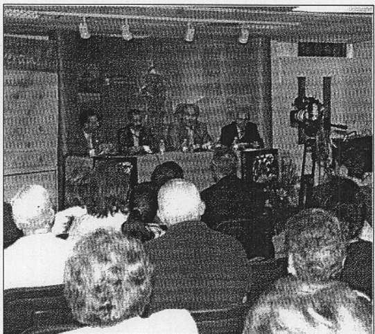
Presentación de la colaboración existente entre el IAJ y la Universidad

De esta manera el curso de verano tradicional de Vera, que se viene desarrollando desde hace 2 años con un notable éxito de participantes y de resultados finales, se le añade otra vertiente muy española, la tauromaquia. No hay que olvidar que Vera es un municipio que tiene una plaza de toros con más de 125 años de vida, prueba de la afición de sus lugareños.