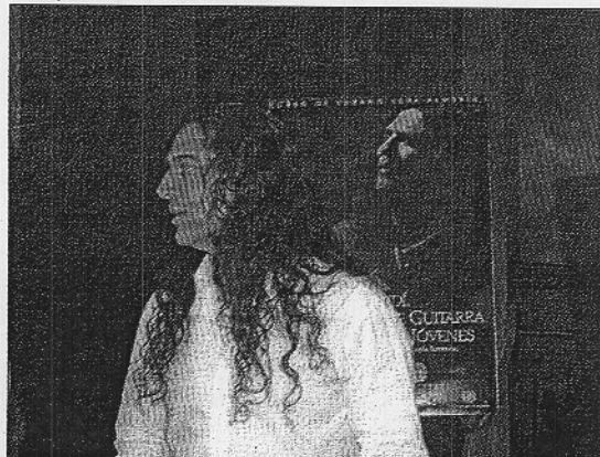
Imagen del famoso guitarrista almeriense José Fernández Tomatito