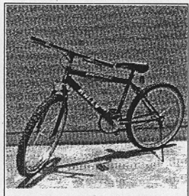
Una bicicleta para préstamo

La experiencia que este grupo de universitarios propone se lleva ya a cabo en numerosas universidades europeas con gran éxito.