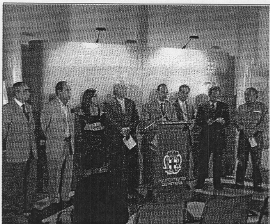
Momento de la presentación de los cursos de verano en Almería