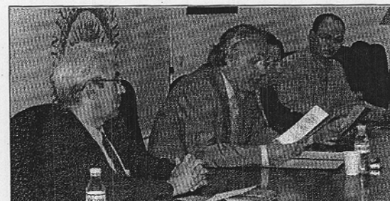
Presentación del curso de verano sobre Migraciones con el Rector

Los directores del curso destacaron el enfoque multidisciplinar de la actividad, pues participarán como ponentes expertos en enseñanza, medicina, didáctica o comunicación, en entre otras áreas, aunque según For-