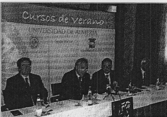
Presentación del curso de verano que se va a celebrar en Vúcar

Con respecto a los contenidos de los cursos que van a celebrarse en Vúcar, sus programas han sido desgranados por los coordinado-