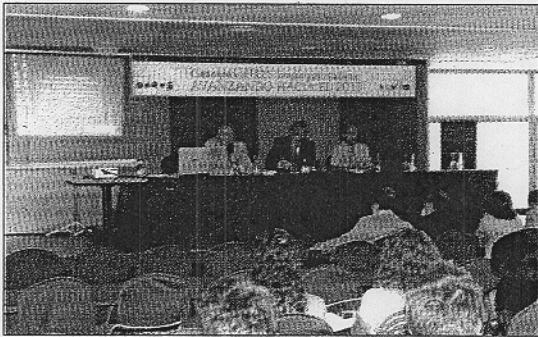
Jornadas "Convergencia al EEES: avanzando hacia el 2010"