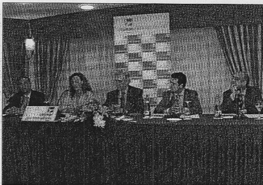
Momento en el que se estaba realizando la inauguración oficial

Este estudio demuestra la valoración del éxito de la organización, atendiendo a la percepción que de ella tiene el ciudadano. En este sentido, los resultados pueden también servir de información para gestores deportivos y para las diferentes instituciones y patrocinadores que han