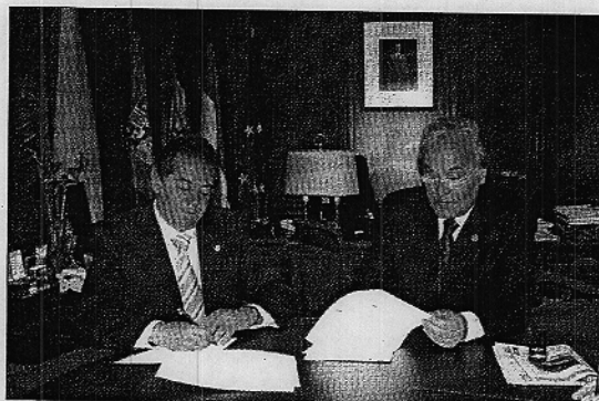
Firma del convenio entre el presidente de Diputación y el Rector de UAL