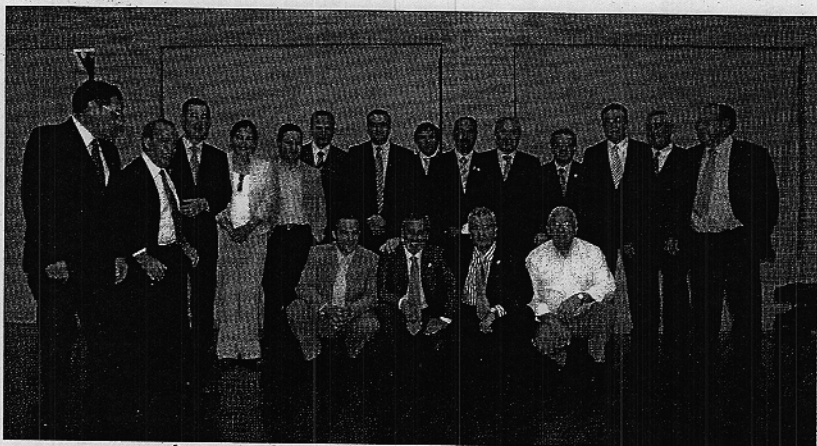
Foto de familia de todos los pueblos que se hermanaron el viernes pasado en la Universidad de Almería