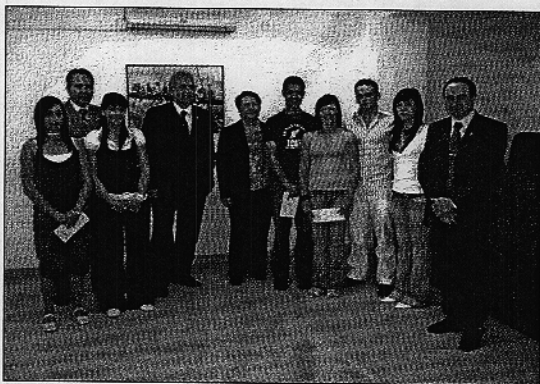
Imagen de los alumnos becados junto al Rector de la Universidad