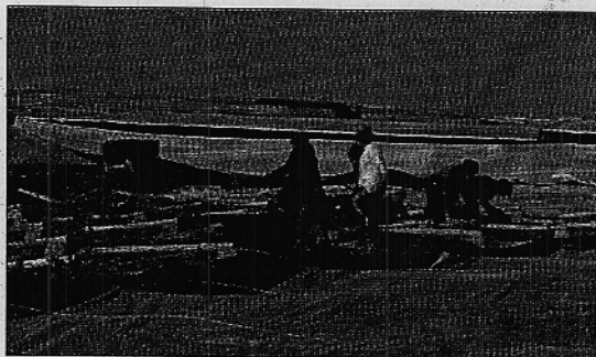
Algunas personas trabajando en invernaderos almerienses

El primer que ha llevado a cabo el Grupo ha sido fabricar la maquinaria, posteriormente patentada por Ro-