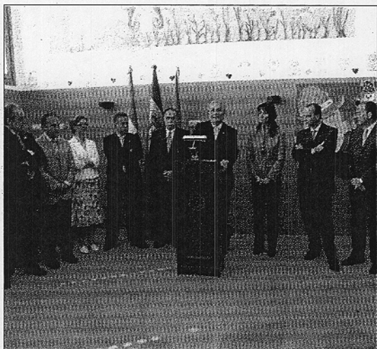
Momento en el que se estaba realizando la inauguración oficial

Cuando hace unos meses el Rector presentaba el proyecto aseguraba que se trata de ayudar a toda la comunidad educativa universitaria a conciliar la vida personal y laboral; de ahí que el horario de la guardería vaya desde la primera hora de clase de la UAL hasta la última del turno