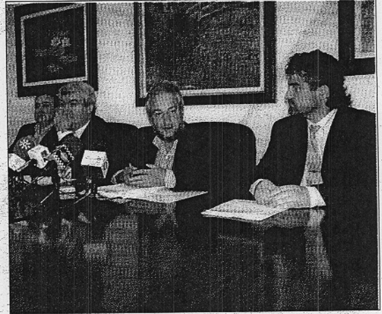
Presentación del VI Foro Provincial de Prevención de Riesgos Laborales