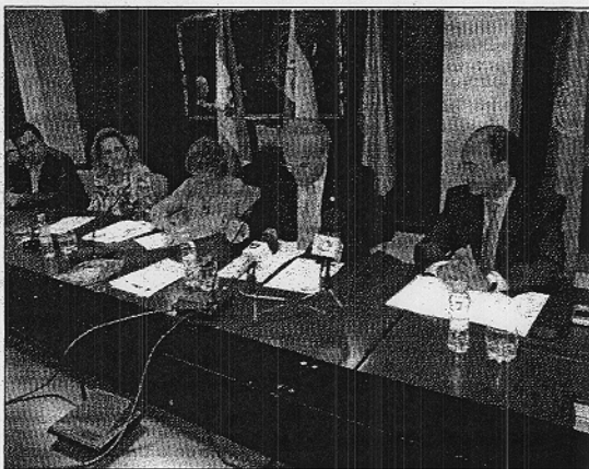
Firma del acuerdo para que los alumnos realicen prácticas en Europa