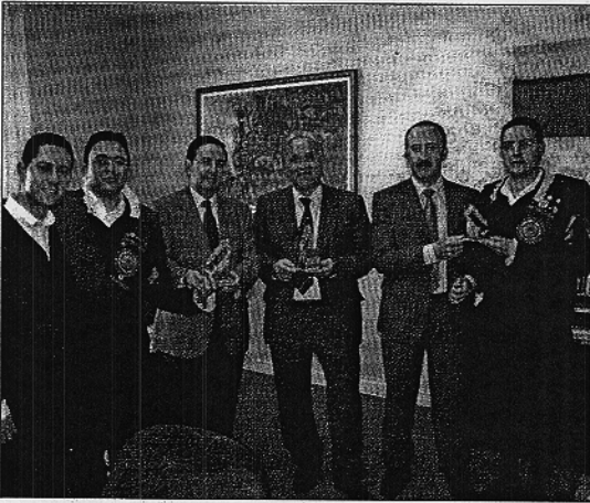
El Rector junto a algunos miembros de la Tuna de la Universidad