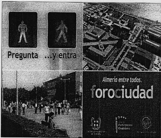
Cartel anunciador de la jornada que celebra el Foro Ciudad