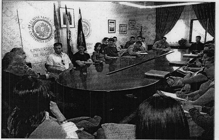
El Rector de la Universidad departa amigablemente con varias decenas de estudiantes de la UAL