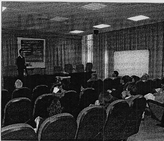
Momento de la celebración del curso sobre la adaptación a Europa