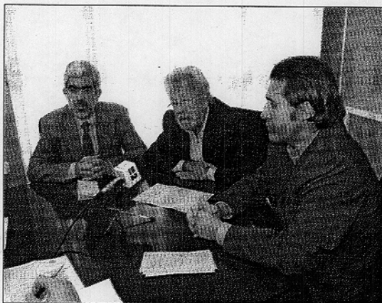
Decano Económicas, presidente de E. sin F. y el director del curso

Entre sus objetivos están el crear un tejido empresarial en los países en vías de desarrollo, que posibilite la formación de pequeños viveros de empresas sociales. En nuestro país están apoyando iniciativas empresariales que han partido del colectivo de inmigrantes residentes en España y de aquellos colectivos que sufren la exclusión social. Según Gamallo, actualmente esta ONG, está colaborando en diferentes proyectos internacionales