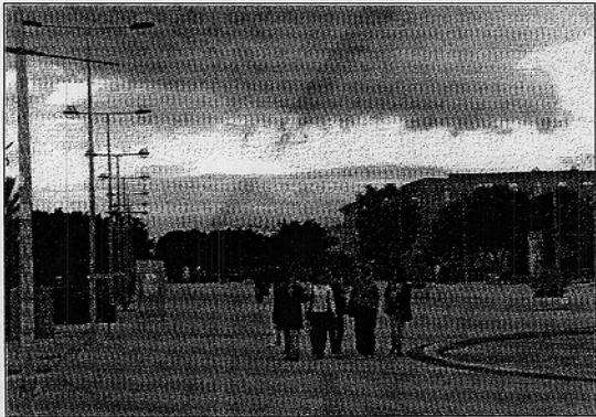
Imagen de algunos alumnos de la Universidad en el Campus