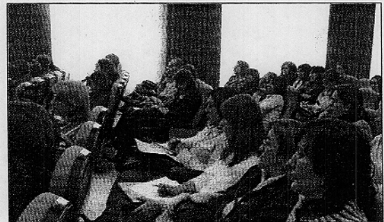
Alumnos de un curso en el que se habló de inmigración e integración

El Consejo Social de la UAL, que ha sido el encargado de convocar este estudio y seleccionar el proyecto, asegura que la labor que este grupo realiza es una "clara apuesta por la formación como vía de integración social" ya que destaca que la educación se convierte en unos de los instrumentos "más potentes" para escapar de la pobreza y la exclusión, ya que facilita el proceso de inserción laboral en una sociedad en la que las exigencias en cuanto a competencias y cualificación "aumentan considerable-