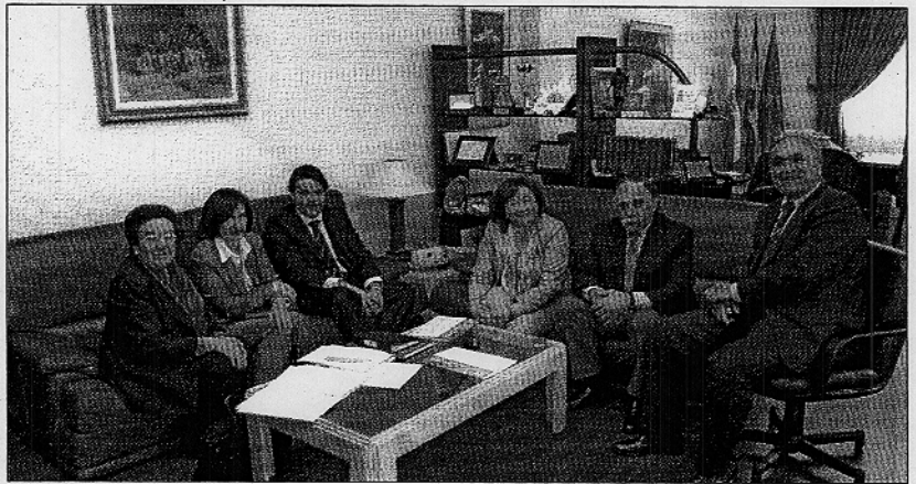
Imagen de la directora general de personas mayores, el delegado de Asuntos sociales y el Rector.