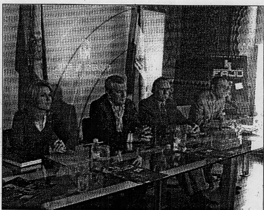
Imagen de la presentación de la X Feria Almeriense de la Juventud