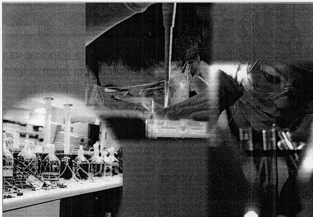
Fotocomposición a partir de elementos propios de laboratorios y de algunos de los jóvenes investigadores trabajando con ellos