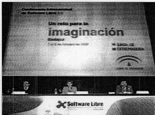
Presentación del II Congreso Internacional de Software Libre