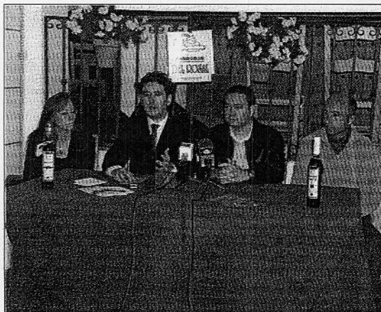
Presentación de Miscelánea en el Museo del Aceite de la capital

Se trata de uno de los comienzos de la Asociación que este mismo mes tiene previsto presentarse