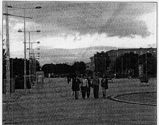
Imagen de algunos alumnos paseando por el Campus de la Cañada

Una vez que terminen la carrera y aprobado con buena cualificación