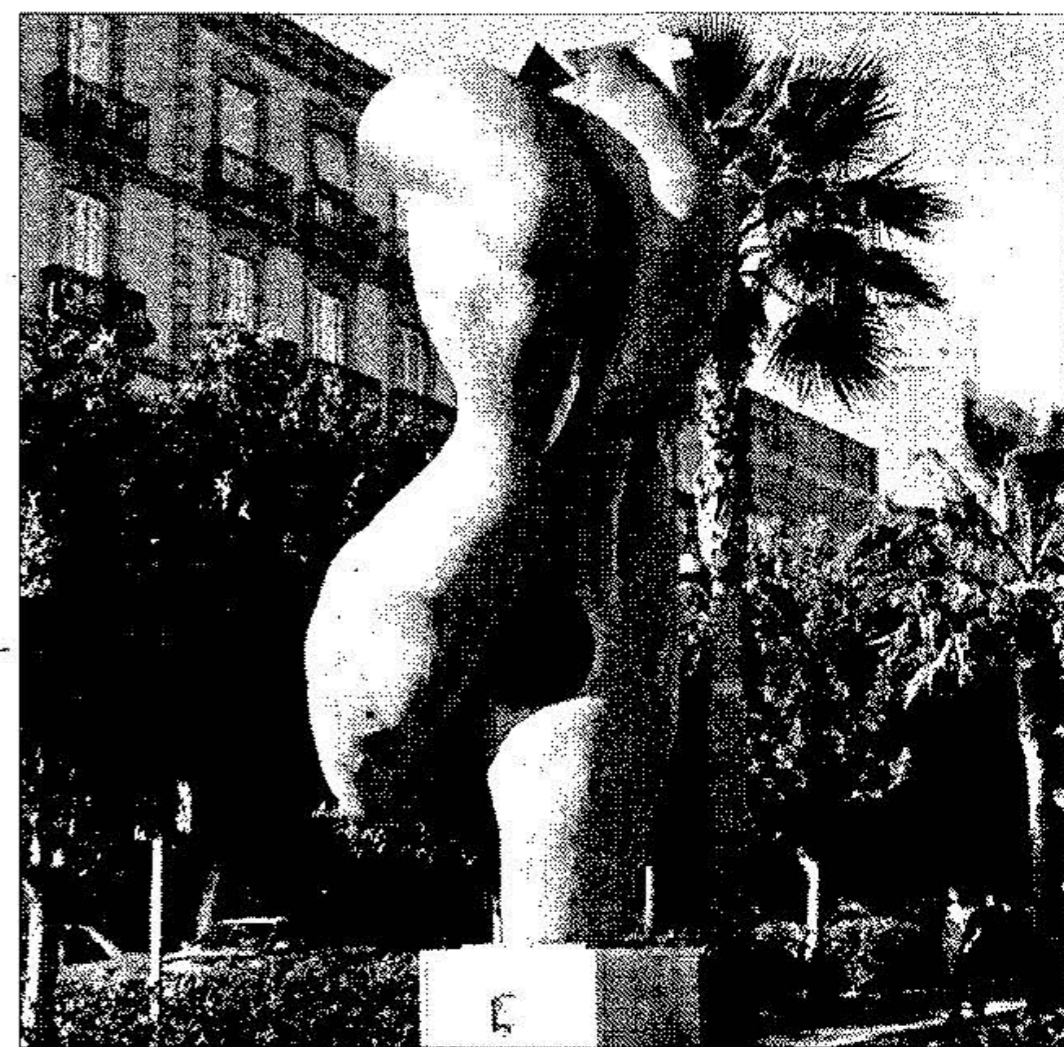
Escultura El Saludo, de Miguel Moreno, situada en la rambla.