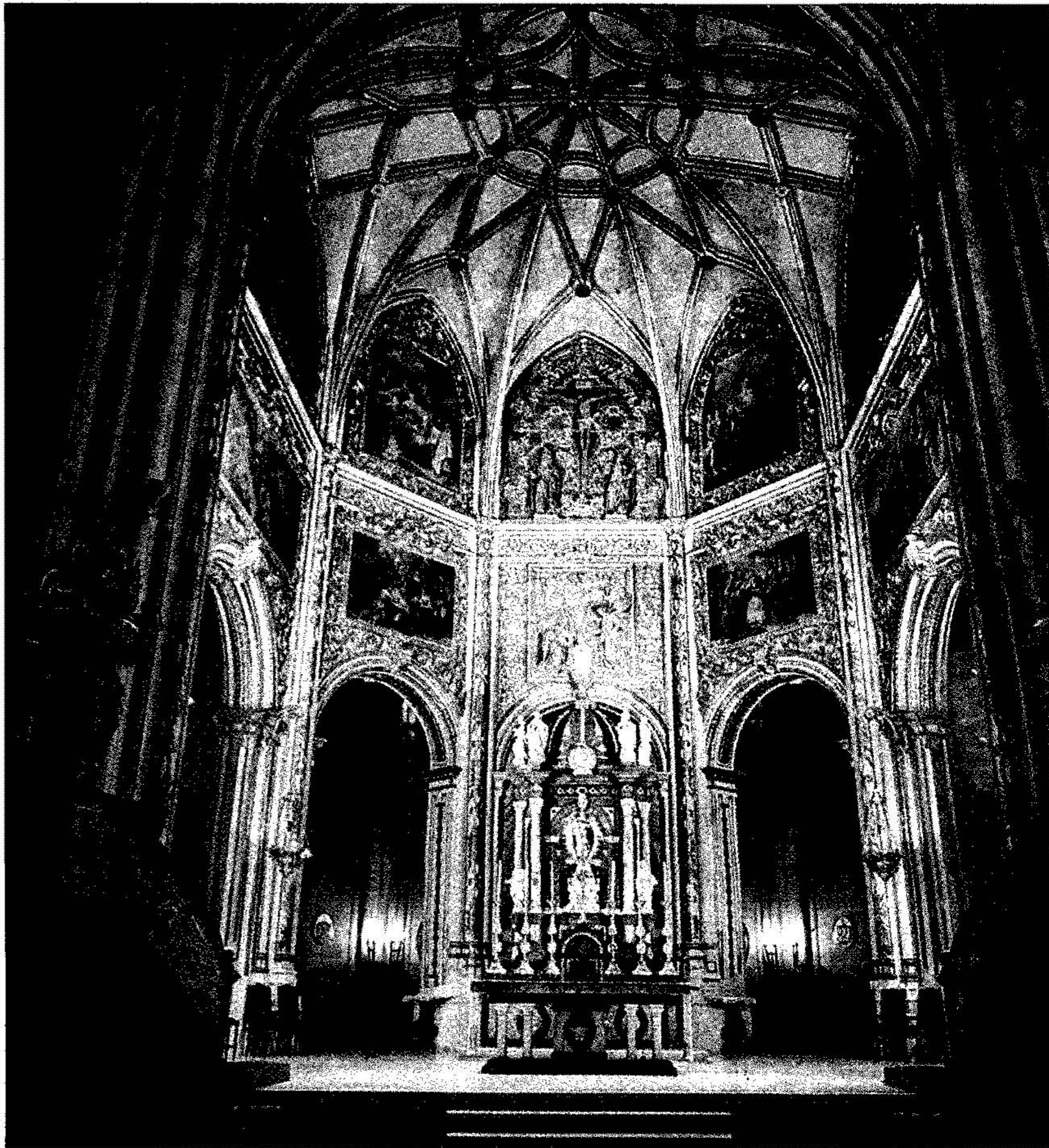
Una imagen de la capilla mayor de la Catedral de Almería, uno de los monumentos más importantes de Almería.

Otra de las novedades que ofrece la guía la encontramos en su visión de conjunto, es decir, se analizan todo tipo de obras, motivado esto porque las publicaciones anteriores se centran sobre todo en los restos arqueológicos y en las obras arquitectónicas.