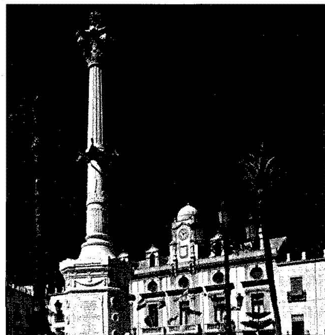
Plaza de la Constitución y monumento a Los Coloraos.