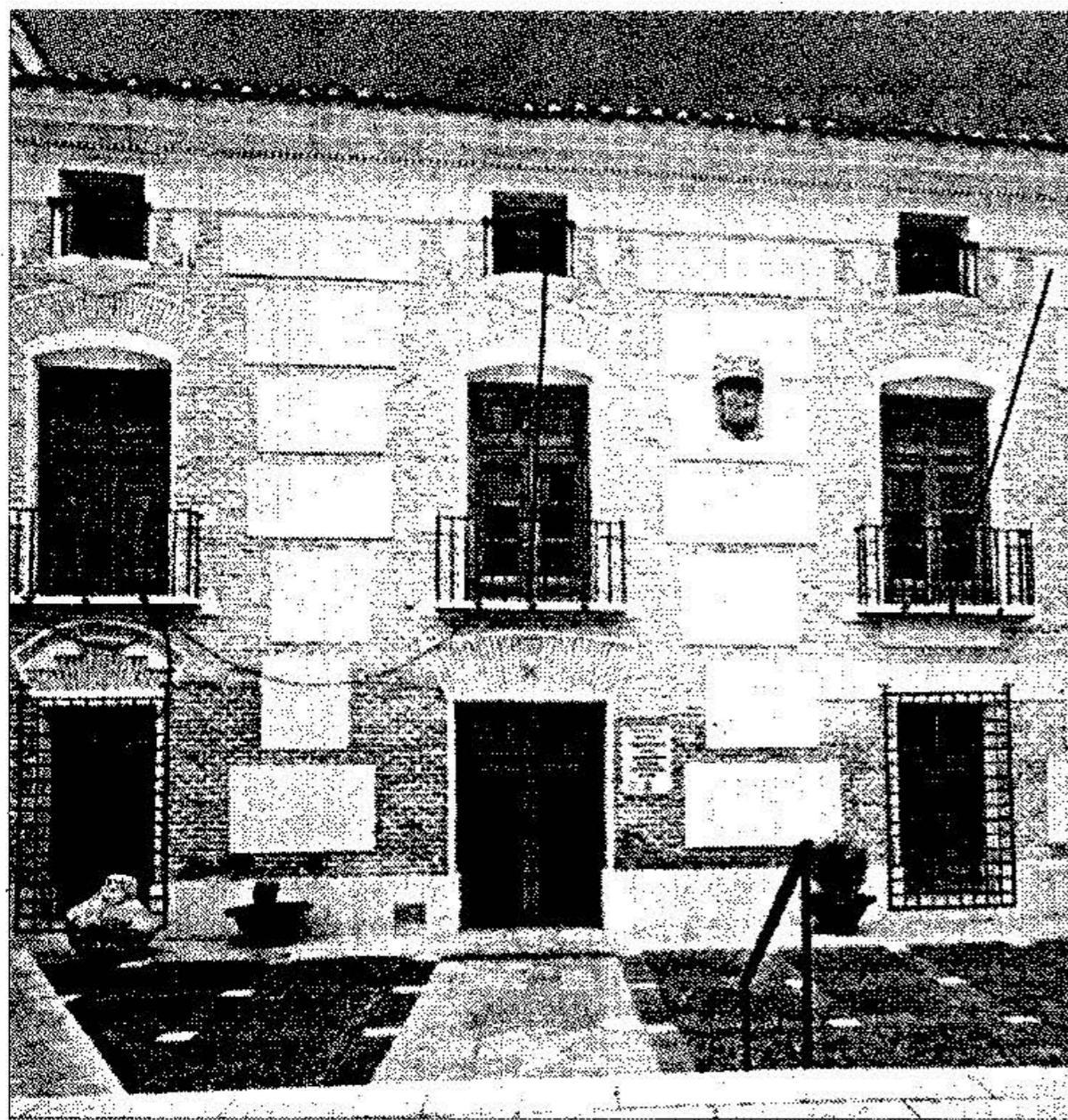
Hospital Real de Vélez Rubio. Edificado en 1765.