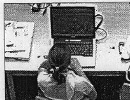
Biblioteca de la UAL

La UAL, pionera en redes WiFi para alumnos