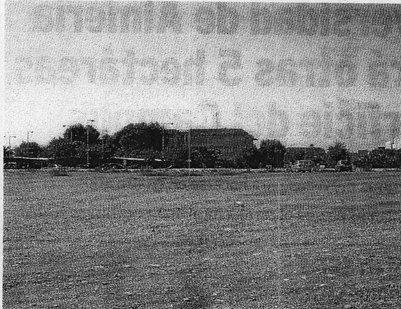
CESIÓN. El suelo que ampliará el campus está ubicado al Este de la actual UAL.

A partir de ahí, empezarán las nuevas construcciones en las que el Rectorado y el Paraninfo se eri-