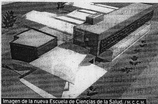
Imagen de la nueva Escuela de Ciencias de la Salud.

La nueva Escuela de Ciencias de la Salud dispondrá de un edificio central y cuatro pabellones con laboratorios para prácticas, de los que uno será para neurociencia. El objetivo es que los alumnos puedan hacer prácticas y desarrollar, por tanto, la vertiente en la que los futuros profesionales deberán estar más formados. Se creará en la zona de Levante.