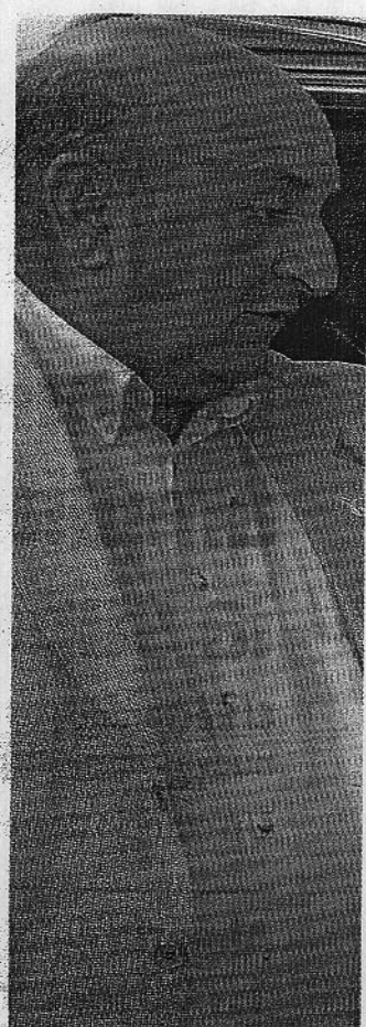
INFRAESTRUCTURAS. El vicerrector

Estará ubicado en la franja Sur del campus y, por tanto, con exce-