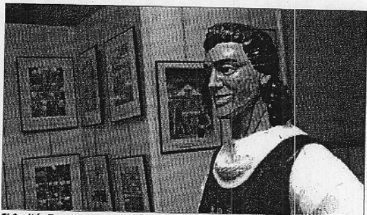
El Capitán Trueno 'presidía' la exposición de ilustraciones. / JUAN DEL PINO

Durante la jornada habrá encuentros con distintos autores españoles, mesas redondas, entrega de premios y sesiones de firmas.