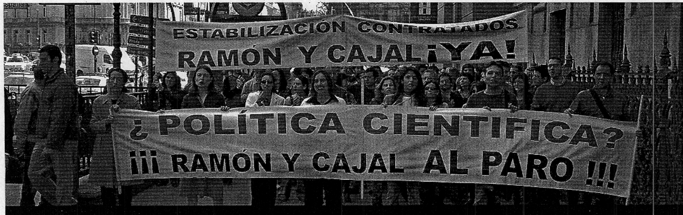
Investigadores del Programa Ramón y Cajal, durante una manifestación contra su situación laboral, el pasado mes de abril.