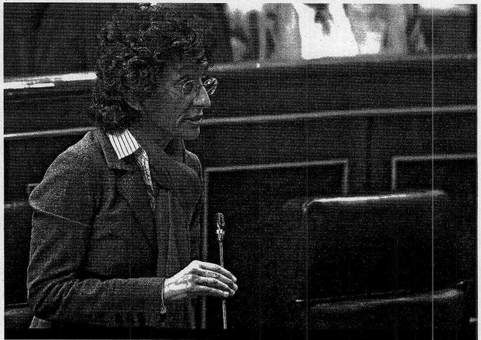
La ministra de Educación y Ciencia, Mercedes Cabrera, durante una reciente intervención en el Congreso de los Diputados

La aplicación más importante de los biosensores ópticos es el desarrollo de métodos de detección de toxinas liposolubles, tanto en las industrias relacionadas con el pescado y marisco fresco y en conserva, como en laboratorios de control de toxinas. La demanda del sector industrial de este tipo de técnicas, alternativas a las técnicas in vitro , es enorme, ya que el coste del bioensayo es muy alto, tanto por su realización como por su lentitud. El bioensayo, tal como está definido en la actualidad, funciona bien para las toxinas diarreicas y puede detectar todas las liposolubles, pero se incorporan falsos positivos debido, entre otras, a la presencia de yesotoxinas aptas para el consumo. Además, para las toxinas de reciente aparición no existen sistemas de control rutinario.