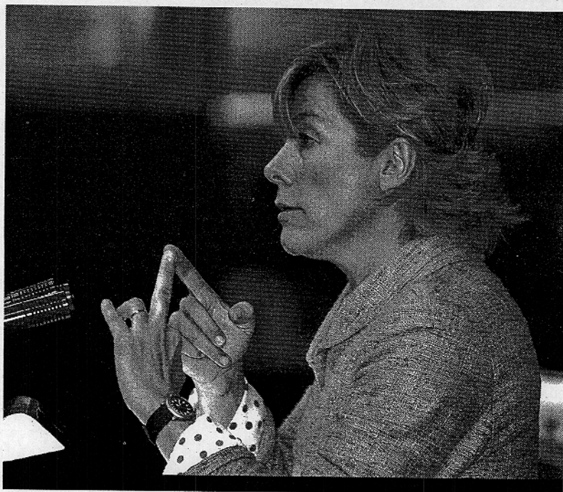
Pilar del Castillo, ex ministra de Educación, Cultura y Deporte e impulsora de la Ley Orgánica de Universidades.

ción porque se deja al desarrollo de la Ley», explica Nasarre, «lo cual ofrece un cheque en blanco al Gobierno y a las universidades». La consecuencia final es, según el PP, evidente: «Más localismo y más endogamia».