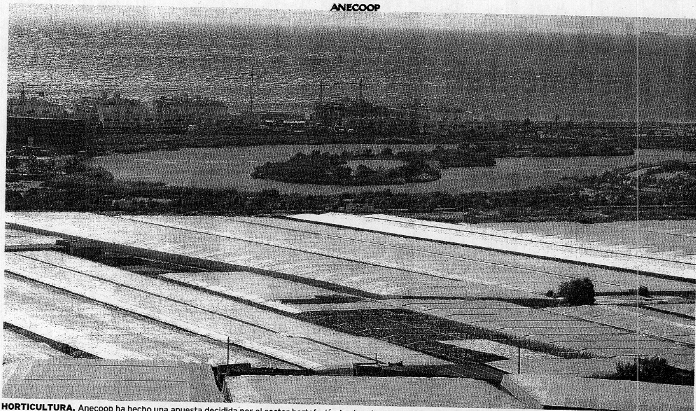
HORTICULTURA. Anecoop ha hecho una apuesta decidida por el sector hortofrutícola almeriense, productor de alimentos de gran calidad.