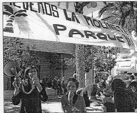
La plaza de Belén fue en punto de encuentro de los vecinos.