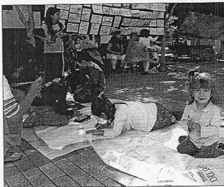
Los escolares de la zona expusieron redacciones y dibujos.