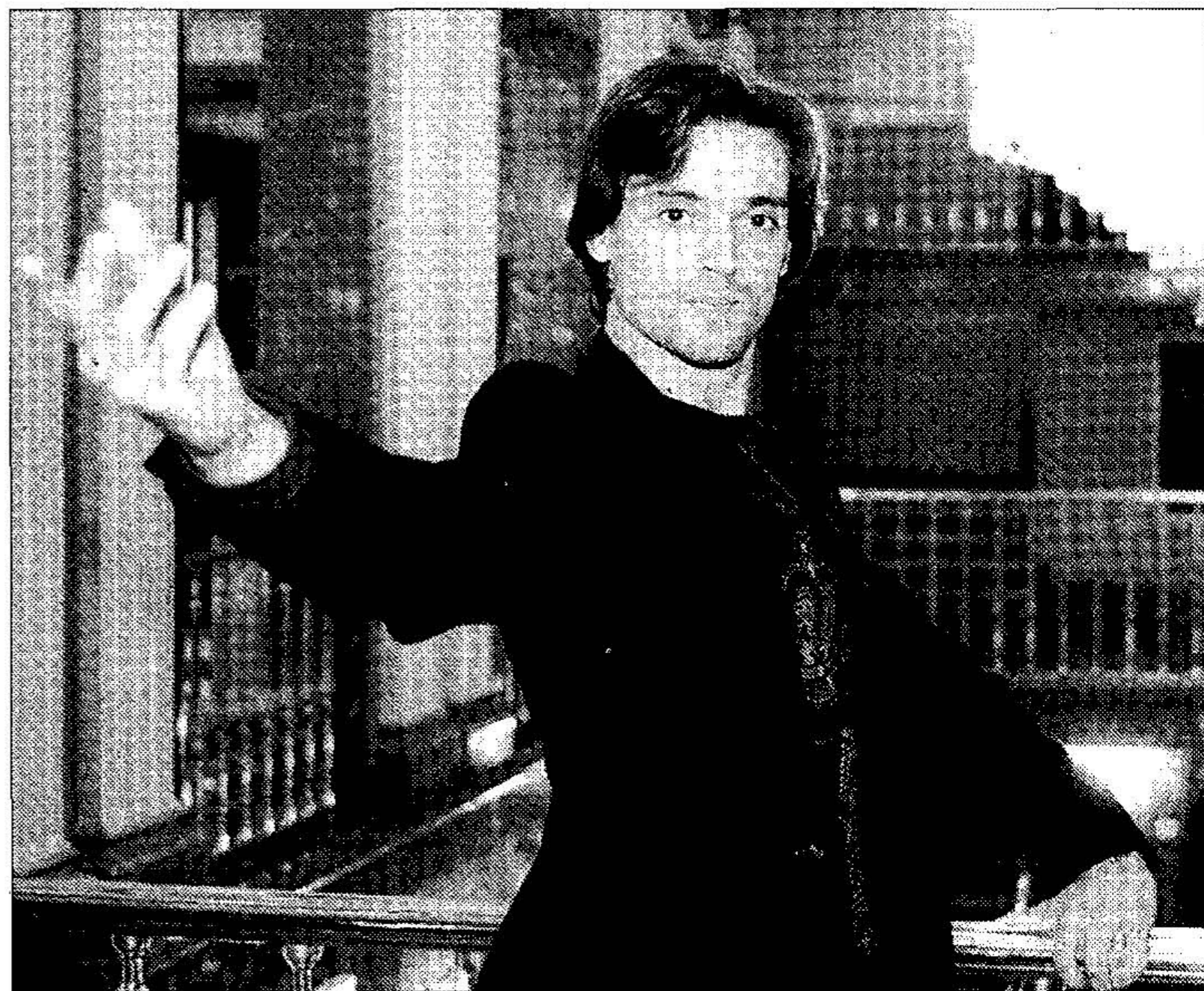
Ángel Corella, primer bailarín del American Ballet.