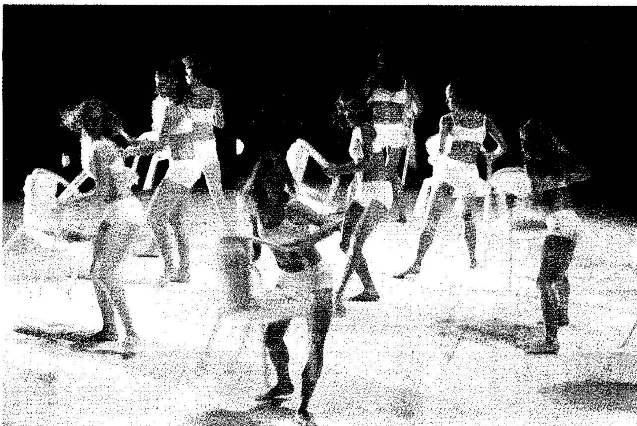
Montaje de vanguardia de Víctor Ullate presentado en la edición de Almería de 2005.

nos señalaron que era la primera vez que asistían a un espectáculo de danza y ahora son ya unos aficionados», sostuvo.