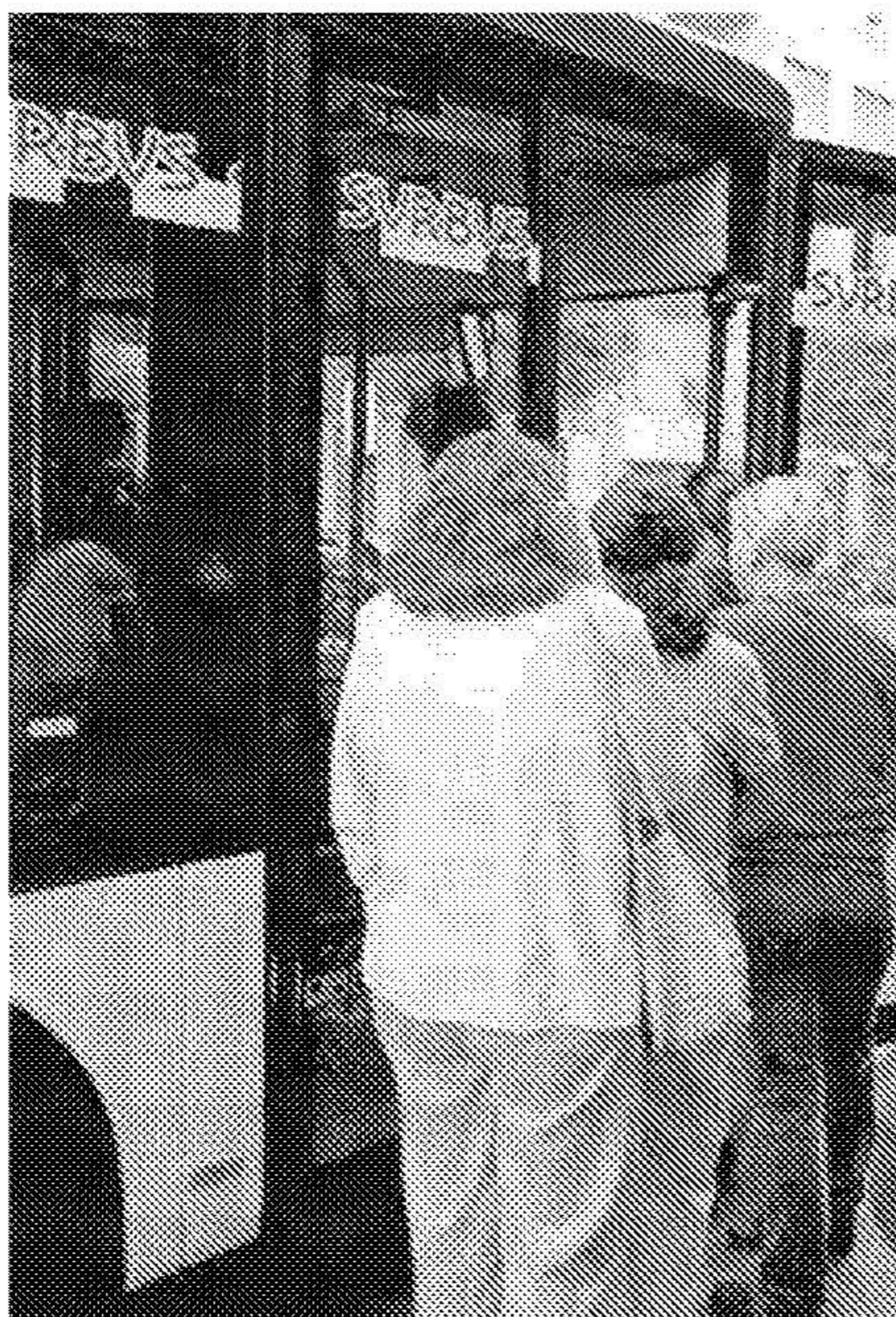
VIAJEROS. Usuarios suben al autobús.

Por el momento, la diferencia de condiciones laborales se ejemplifica en los días de descanso, 34