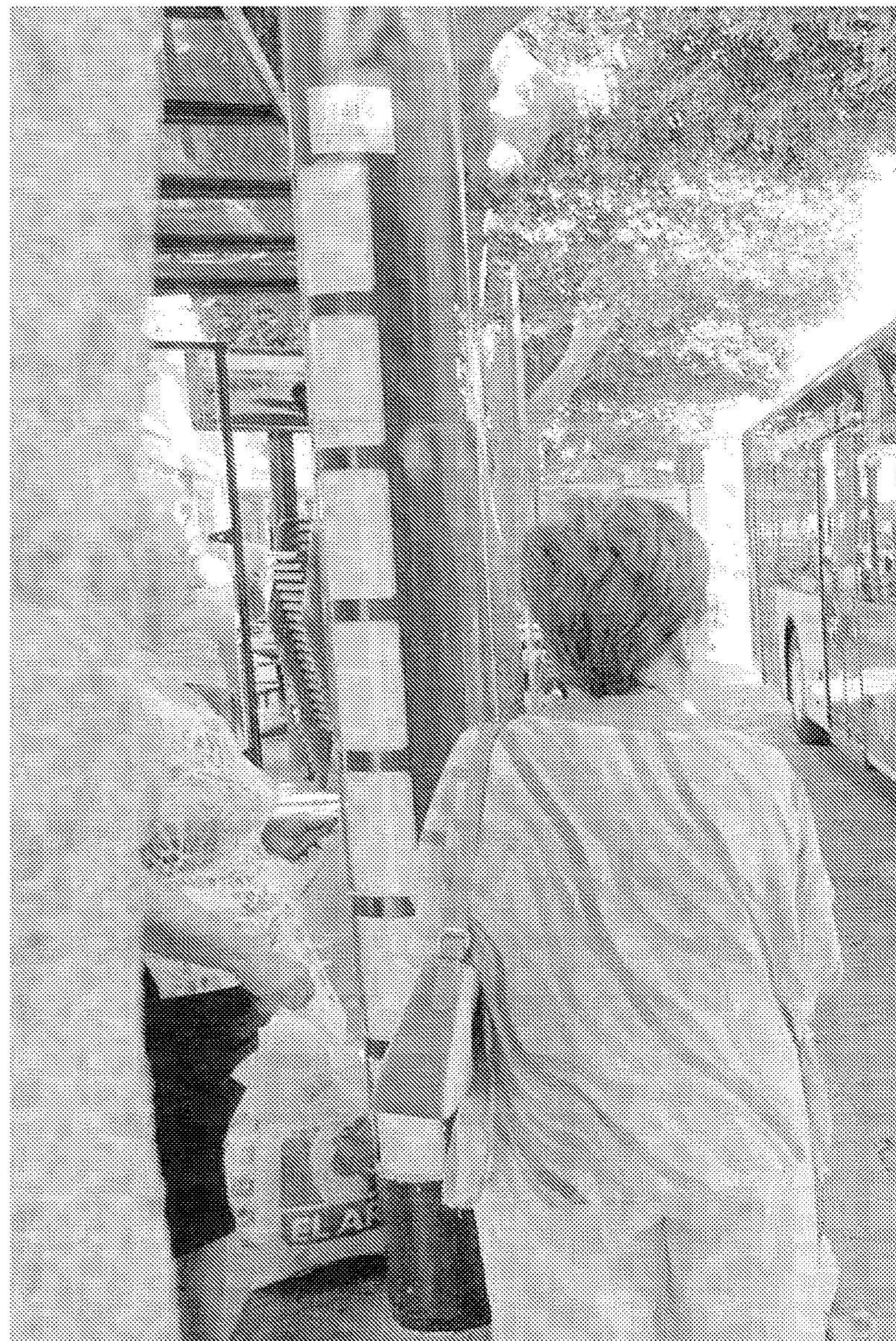
PARADA. Un grupo de personas aguardan en el Paseo de Almería la llegada del autobús.

Desde el Ayuntamiento y desde la empresa se pensó inicialmente en inaugurar oficialmente el servicio antes de la pasada Feria de Almería, sin que finalmente se produjera dicho acto, y sin que se haya vuelto a plantear una nueva fecha para dicho