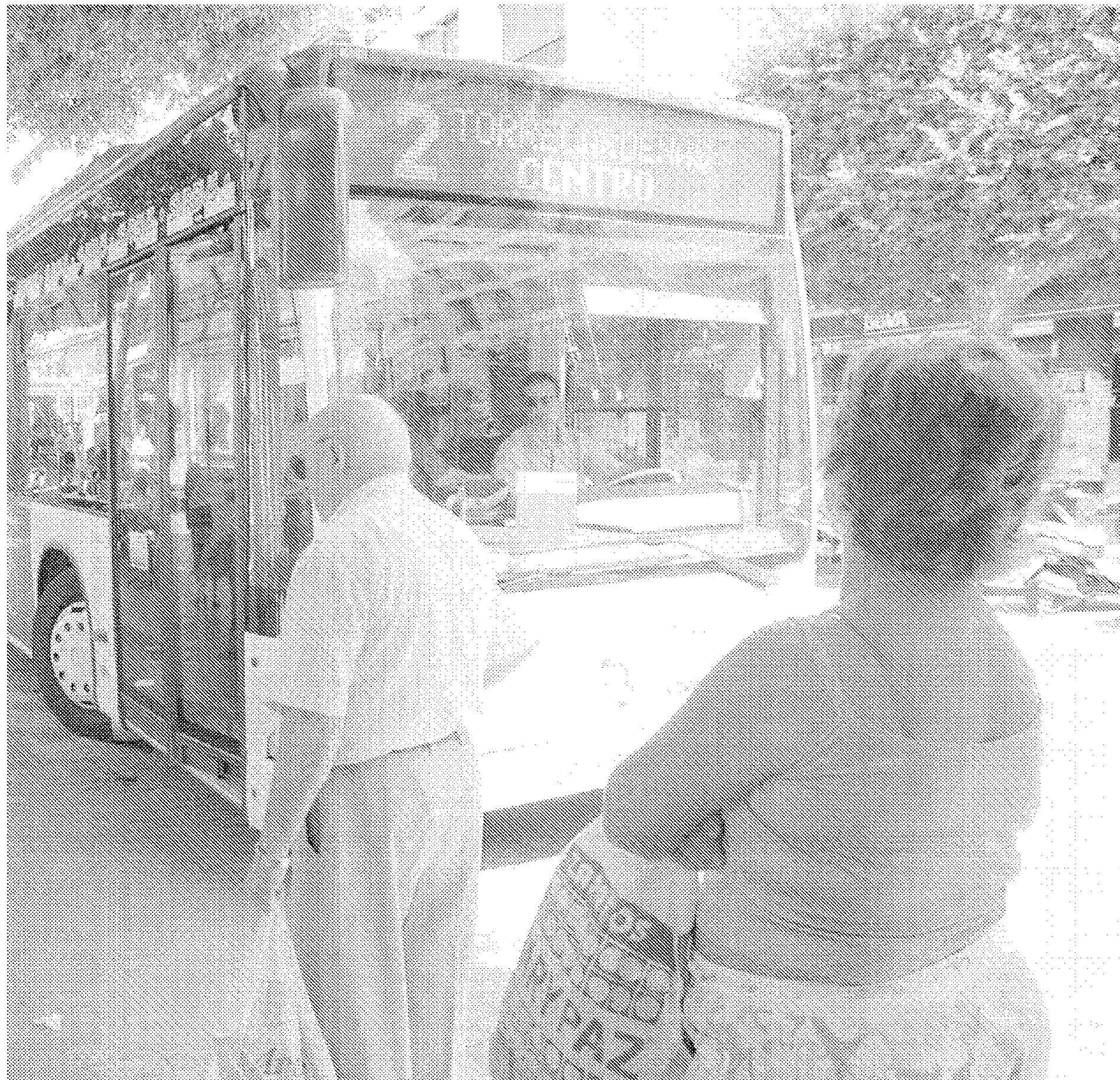
uno de los medios de transporte público más utilizado por los almerienses.