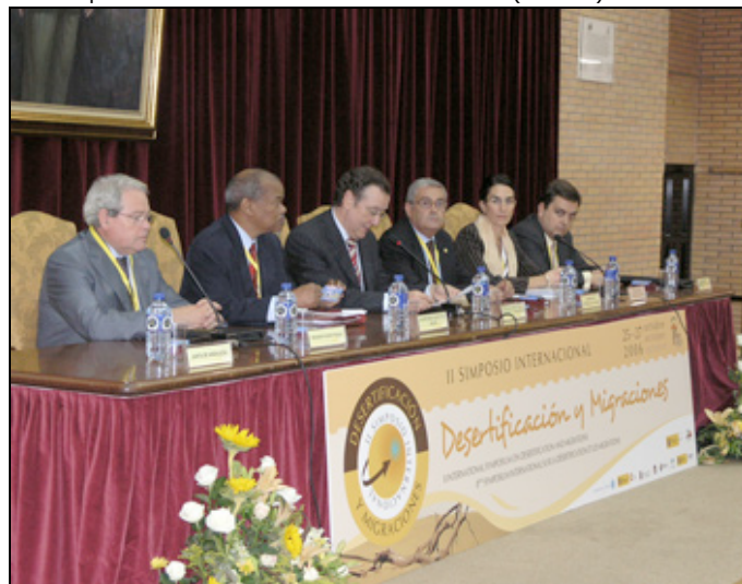
Mesa de trabajo del Simposio

Entre los objetivos que persigue la celebración del Año figura el de "concienciar sobre las consecuencias de la desertificación: presentar la desertificación como una seria amenaza para los ecosistemas vulnerables y para la humanidad, que podría agravarse aún más con el cambio climático y la pérdida de diversidad biológica, haciendo el debido hincapié en la relación de este fenómeno con la inseguridad alimentaria, la pobreza, la migración y otros conflictos en el contexto de los objetivos de desarrollo del Milenio".