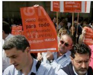
Concentración de los profesores de la UPV frente al Gobierno vasco.

Según ha advertido, sería una "locura" y una "irresponsabilidad" que la Administración "dilatase la respuesta a esta situación" y advirtió de que, "si el lunes no hubiese ninguna comunicación, adoptaríamos una respuesta". Ante la preocupación de los universitarios por los problemas que pueden presentarse en la recta final del curso, el portavoz de CC OO indicó que el inicio "real" de las negociaciones "evitaría" una situación "dramática" y "normalizaría la situación".