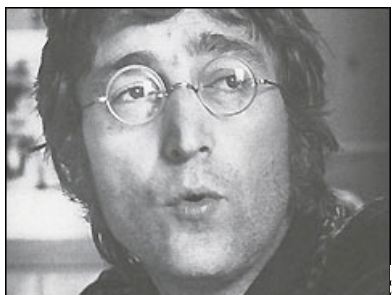
Imagen de archivo