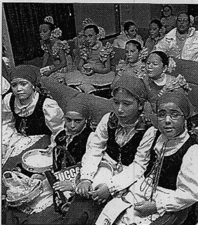
'La traíña' también actuó.