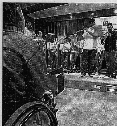
Un niño hospitalizado escucha al coro de la UAL. / EL