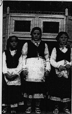
Unas niñas vestidas de pastorcillas. / J. MARFIL