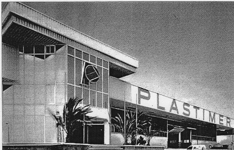
■ Sede de la empresa en el polígono La Redonda de El Ejido, construida en 2004 por Jarquil.

El nuevo Consejo de Administración elaboró a principios de año un nuevo plan de viabilidad, supervisado por la consultora Erns&Young, que fue refrendado en un 90% por la Junta General de Acreedores. El grupo TPM, segundo productor nacional de plásticos, sufrió pérdidas millonarias en el ejercicio de 2004 a consecuencia del alza del 90% en las materias primas, por el precio del crudo, que no se repercutió en los clientes, principalmente agriculto-