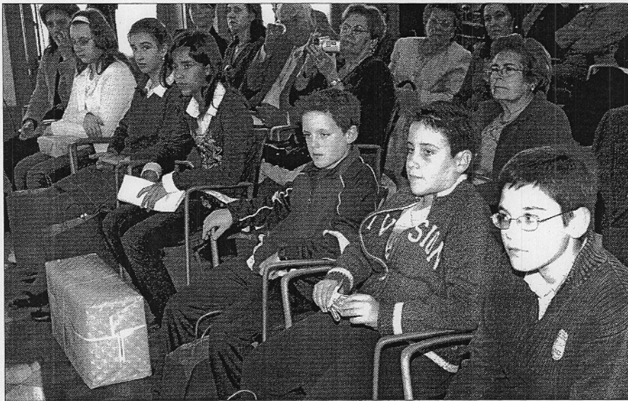
Más de 150 personas acudieron a la entrega de premios del V Certamen Literario Escolar Andaluz.

El Día Internacional del Voluntariado no deja de ser un tributo a todas estas personas que luchan día a día por los demás, basándose en principios como la justicia social, la participación, la solidaridad o la propia implicación personal.