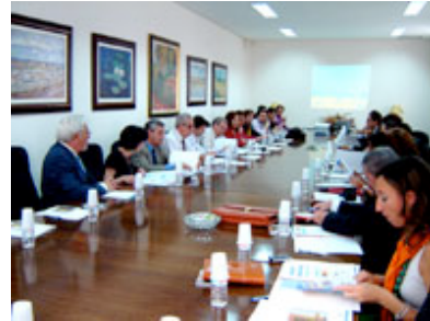
Reunión del grupo de investigadores del sector turismo