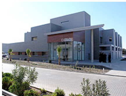
Edificio de Ciesol en la Universidad

(7/4/2006 08:36) | Almería > Universidad