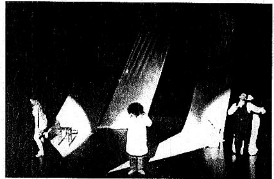
Momento de la puesta en escena de 'La lección'