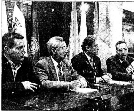
Acto de presentación del curso sobre la ciudad de Baria

El programa se inicia el jueves con la apertura de las jornadas a las 17 horas. Acto seguido está prevista la intervención del profesor de