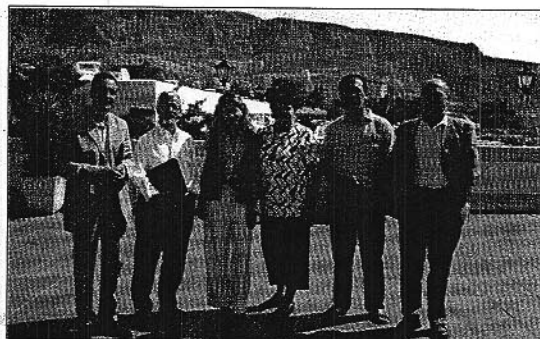
Dirección del Curso de Verano de Lectura, ayer en Aguadulce