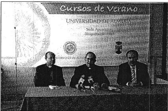
El Obispo de Córdoba, Juan José Asenjo, ayer en Aguadulce

Asenjo sostuvo que "existe una ofensiva laicista en España, poco respetuosa con los derechos de los fieles y poco respetuosa con la libertad religiosa", al tiempo que lamentó que "en su momento los responsables políticos tomaran la iniciativa de considerar matrimonio las uniones homosexuales y que el Parlamento aprobara estas uniones. No las uniones en sí mismas, sino que sean consideradas como matrimonio, algo en lo que también está de