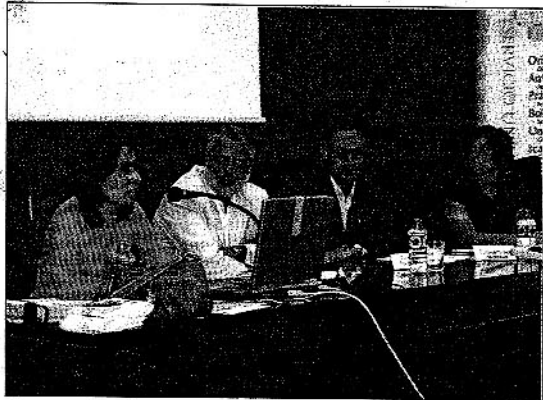
Momento de la ponencia sobre Economía Social

Además, en esta jornada los técnicos del Programa de Autoempleo del Servicio Universitario de Empleo presentaron el tercer número de la Revista Bimensual 'Emprendiendo', que está elaborada por ellos.