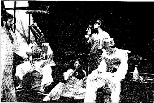
Una actuación llevada a cabo por el Aula de Teatro

■ JORNADA DIFUSIÓN DE LA CULTURA EMPRENDEDORA ENTRE LOS ALUMNOS