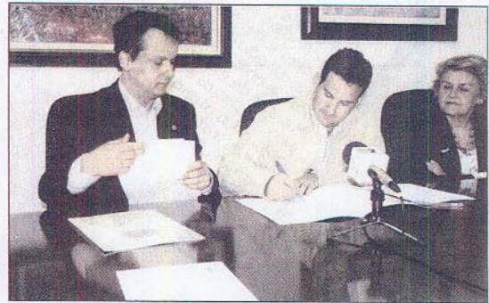
Momento de la firma del acuerdo entre la UAL y Rocamar

Rocamar y Estudios del Tiempo Presente coinciden en la necesidad de contribuir a recuperar el conocimiento de la historia más reciente, ocultado en buena parte por la dictadura de Franco, y conseguir así que no queden en el olvido la identidad de hombres y mujeres que lucharon contra el franquismo y a favor de una República democrática. De ahí nace este trabajo concreto,