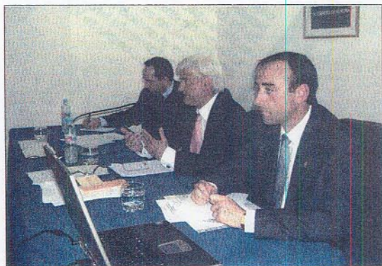
Los ponentes de las jornadas de Protección de Datos

Cuando se declara una infracción, la más frecuente es tratar los datos sin el conocimiento de los afectados, que es un hecho grave cuya sanción oscila entre los 60.000 y los 300.000 euros. "Luego, a mayor distancia, se producen otro tipo de infracciones, las más características son cesiones ilícitas de datos cuya sanción va 300.000 a 600.000 euros, o falta de información en el tratamiento de los datos", explicó Rubí.