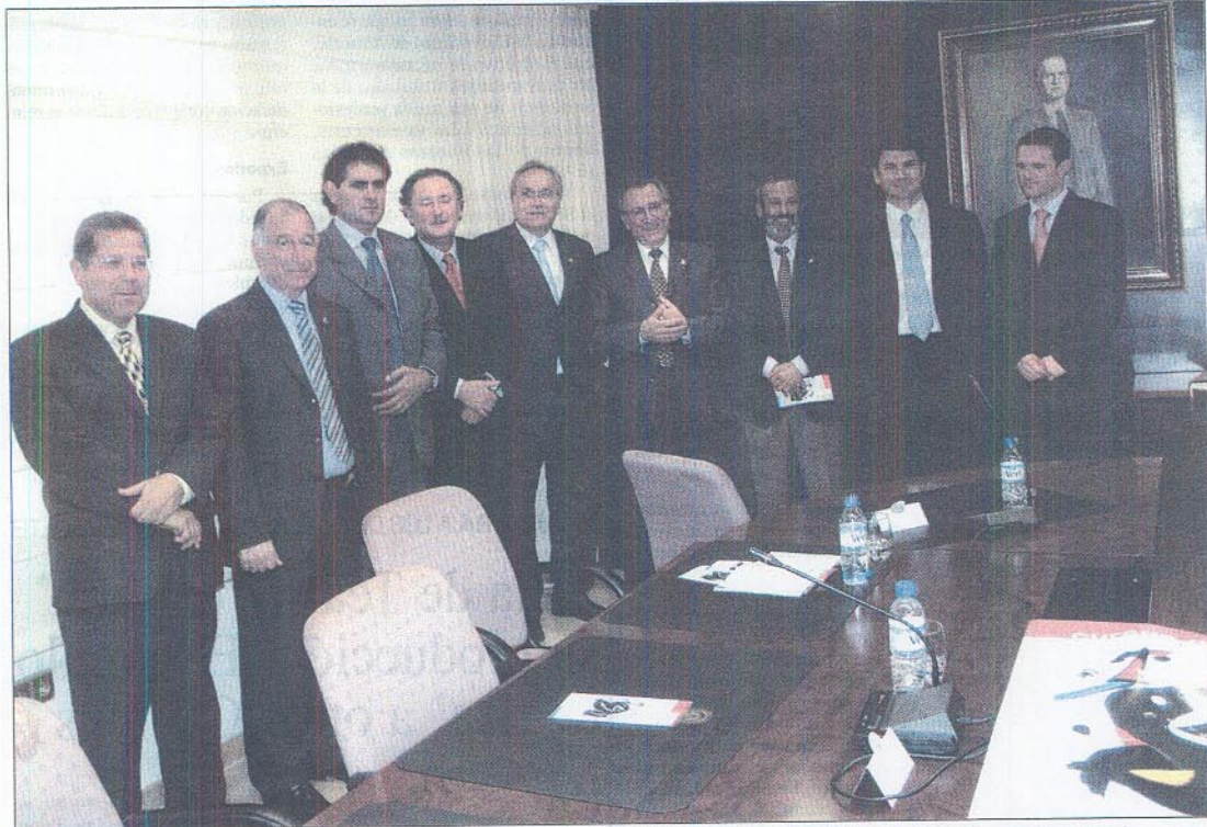
Los representantes de los ayuntamientos que serán sede de los Cursos de Verano, junto al Rector y el cantante Manolo Escobar