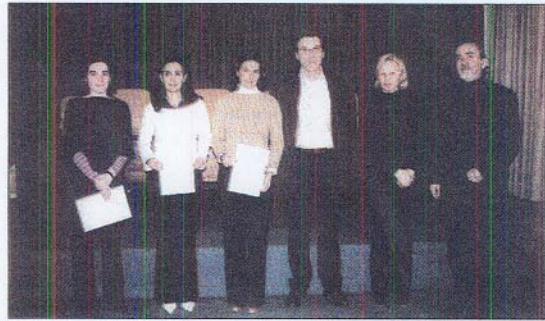
El director del Instituto Goethe hace entrega de los diplomas