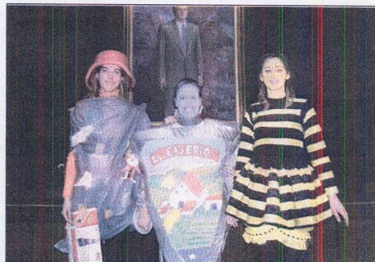
Las vencedoras del concurso de disfraces de la UAL