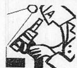
«Hemos mostrado que el AhR está implicado en el control de la migración de células tumorales interactuando con la ruta de señalización celular»

Uno de estos proyectos, en el que estudiamos el papel del receptor de dioxina (AhR) en desarrollo tumoral, resulta especialmente atractivo. El AhR es bien conocido desde hace más de dos décadas como un intermediario esencial en carcinogénesis inducida por compuestos muy tóxicos, como dioxinas y benzo[a]pirenos.