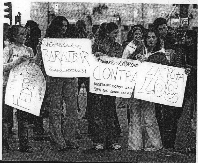
Un grupo de estudiantes sostiene pancartas en la protesta contra la ley de educación celebrada en Vitoria.

versitarios». Al contrario, opina que hay personas que no deberían estar en la Universidad «porque no aprenden nada». Prosigue: «Sólo acceden más tarde a un mercado laboral precario. España es uno de los pocos países donde una carrera no garantiza trabajo».