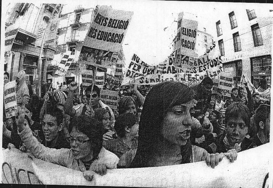
Alumnos convocados por el Sindicato de Estudiantes, durante la manifestación en contra de la LOE del 12 de noviembre, en Barcelona.

Adicionalmente, hemos observado que el AhR está regulado epigenéticamente (por hipermetilación de su promotor) en el 30-35% de los linfomas primarios por un mecanismo que implica la inactivación del regulador transcripcional Sp1 y que los ratones knock-out para el AhR son mucho más sensibles a linfomas inducidos por irradiación que los que expresan AhR. Nuestros datos sugieren que el AhR representa un nuevo gen supresor de tumores, potencialmente útil en diagnóstico y terapia de leucemia.