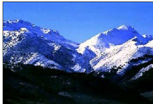
Vistas de Sierra Mágina