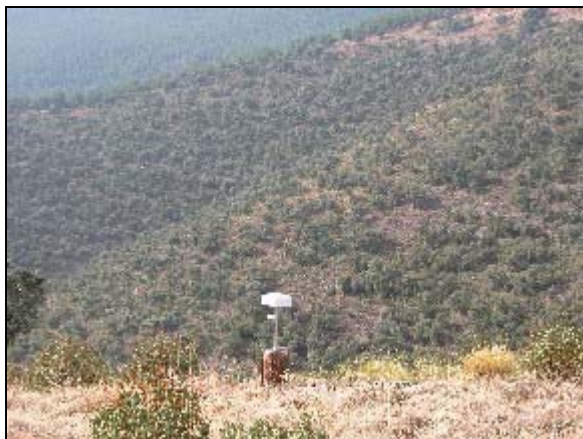
Detalle de una estación en Sierra Nevada

estimar y predecir la energía solar disponible en los distintos puntos de zonas de topografía compleja, y de forma continuada en el tiempo. Dentro de este tipo de terrenos se encuentran muchos parques naturales de nuestra región, como Sierra Nevada, las sierras de Cazorla, Segura y las Villas o Sierra Mágina. Para ello emplearemos una metodología basada en Redes Neuronales Artificiales, que usará como variables de entrada la información contenida en los Modelos Digitales del Terreno y las estimaciones de la radiación solar a partir de imágenes de satélite de ésta. Los resultados serán evaluados con campañas de medidas de tierra en zonas de Andalucía Oriental”.