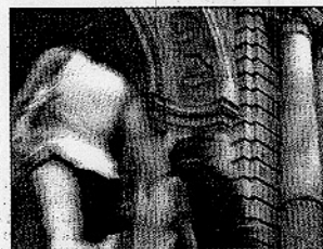
PARANINFO de la Universidad de Sevilla.

Esta semana, el Paraninfo de la Universidad acoge el III Congreso de Universidades de Gaceta Universitaria . El edificio, donde actualmente está situado el Rectorado, fue en el pasado una antigua fábrica de tabacos. La misma fábrica en la que trabajaban las cigarreras de 'Carmen', la ópera escrita en 1875 por Georges