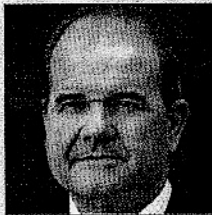
MANUEL CHAVES Presidente de la Junta de Andalucía. Desde que ocupa este cargo, tiene su plaza de profesor de Derecho en la Universidad de Córdoba en excedencia.