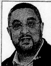
JESÚS M. DE MIGUEL Catedrático de Sociología en Harvard University. Entre sus obras, está la confección del primer ranking de calidad de las universidades en España.

Q ué destacaría de este Congreso de Universidades? Sobre todo, destacaría el contenido del Congreso: el papel social de la Universidad. Es importante que los universitarios no hablemos siempre acerca de los títulos académicos y que no nos miremos tanto el ombligo.