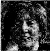
MARÍA JESÚS SAN SEGUNDO Ministra de Educación y Ciencia. Profesora de Economía en la Universidad Carlos III, uno de los retos de su departamento es reformar la polémica LOU.