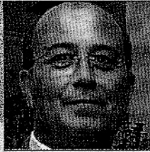
MIGUEL FLORENCIO Rector de la Universidad de Sevilla. Hasta el año pasado, además, ocupó el puesto de presidente en la Confederación de Rectores de Universidades Andaluzas.