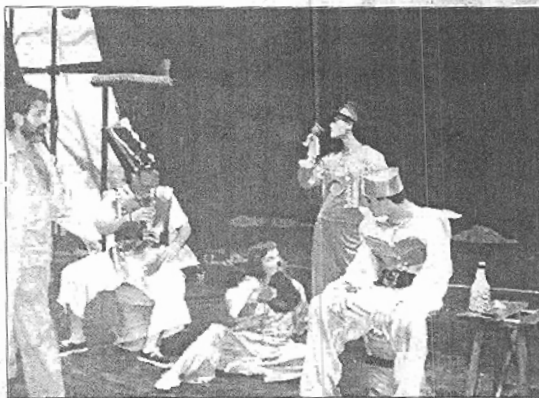
El personal laboral del campus elige hoy a sus representantes/ R.O.